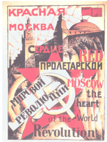
VKHUTEMAS (Talleres Técnicos y Artísticos del Estado): “Moscú Roja, corazón de la Revolución Mundial”, 1921.

El arte del afiche consiste en “presentar de manera sintética y poderosa el espíritu de una época, los sentimientos, el pensamiento y la manera de ser de la gente y las actitudes sociales. Los afiches bien pueden ser una referencia y una crónica de un país” 1 . La victoria de los bolcheviques en 1917 produjo fundamentales cambios sociales, políticos y culturales que inspiraron a una nueva generación de artistas. El arte de los primeros años de la Rusia revolucionaria tuvo efectos internacionalmente enormes y duraderos, ya que los gigantescos cambios en la sociedad afectaron también a la propaganda y la manera de realizar afiches, que se estableció como un arte en sí mismo y se convirtió en un indispensable medio de difusión política.