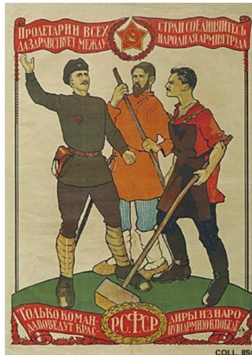
D. Moor: Proletarios de todos los países, ¡uníos! , Moscú, 1919. 2

Los afiches, en un principio, aseguraron y reforzaron las políticas del Estado pues eran un importante medio de propaganda política y, al estar libres de consideraciones comerciales, jugaron un decisivo papel en las ceremonias y rituales del régimen, pero su lugar se desplazó posteriormente y pasó a ser de una herramienta de agitación temporaria a la de un objeto de exhibición.