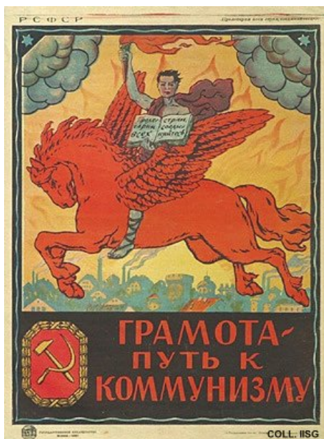
GOSIZDAT 4 : “El alfabetismo es el camino hacia el comunismo”, Moscú 1920.

Con el afianzamiento de José Stalin (1879-1953) en el poder a fines de la década de 1920 se aplastó toda libertad artística y se terminó con el brillante arte revolucionario.