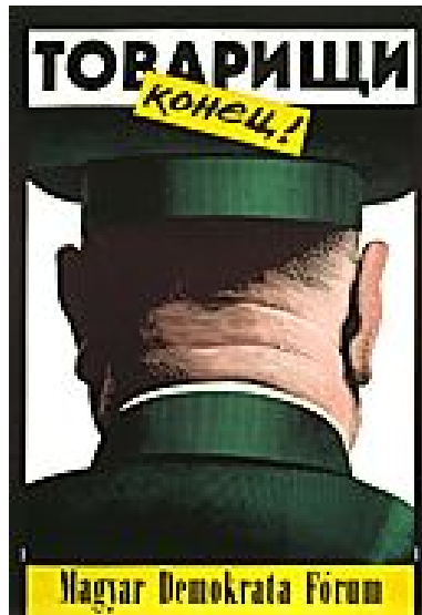
István Orosz: “Camaradas, ¡El fin!”, Budapest 1989.

En las elecciones del verano (boreal) de 1990 en Hungría, los partidos políticos no tenían dinero para hacer campaña en televisión y el MDF adoptó el famoso afiche de István Orosz, Camaradas, ¡El fin! (1989) que, para muchos, era demasiado caro y obsoleto en la edad de la televisión. Cabe destacar que el afiche está escrito en ruso, con caracteres cirílicos, lengua que los húngaros conocían pues tenían que estudiarla –de mala gana– obligatoriamente desde la instauración del estalinismo en ese país. El perfil es indudablemente ruso y hace referencia a las tropas estacionadas en Hungría. Este afiche se publicó en casi todos los diarios del mundo, incluso en Argentina, fue tapa de libros 19 y hasta se vende como postal en museos húngaros.