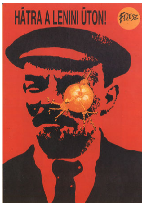
ANÓNIMO: “Hacia atrás en el camino de Lenin”, Budapest 1989.

La potencia del mito de Lenin era tan fuerte en toda ECO que durante la invasión del Pacto de Varsovia a Checoslovaquia en 1968, hubo gráficos callejeros espontáneos en contra de la misma que mostraban a un Lenin triste y traicionado. Pero luego de la caída del Muro de Berlín, un retrato de Lenin en 1989 encargado por el FIDESZ, antes de las primeras elecciones libres después de décadas de régimen “socialista”, fue utilizado como una advertencia del pasado. Lo que se estrella en el rostro de Lenin es una naranja, siendo la “naranja húngara” un concepto irónico (también el nombre de una publicación satírica) utilizado por este partido juvenil en referencia al filme (prohibido durante años) El testigo 18 , en el cual se mostraba la ridícula pretensión del régimen estalinista de Rákosi de producir naranjas en un clima poco apto para ello.