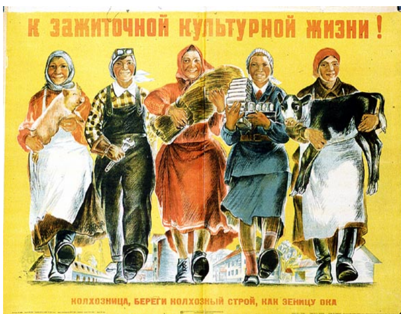
Aleksei Sitaro: "Hacia una próspera vida cultural", Mosú 1934.

Después de la Segunda Guerra Mundial la infraestructura de la región estaba tan dañada que las comunicaciones eran prácticamente inexistentes, de ahí que el afiche político se convirtiese en un importante medio de comunicación. Como medio masivo era la herramienta perfecta para la diseminación de la propaganda del partido de masas, y los afiches se distribuían en todos lados: fábricas, oficinas, clubes, las calles, con lo cual se intentaba informar a la población de la naturaleza de la dictadura del proletariado y para moldear conductas, actitudes y gustos de los trabajadores en representaciones que también marcaban físicamente el espacio público.