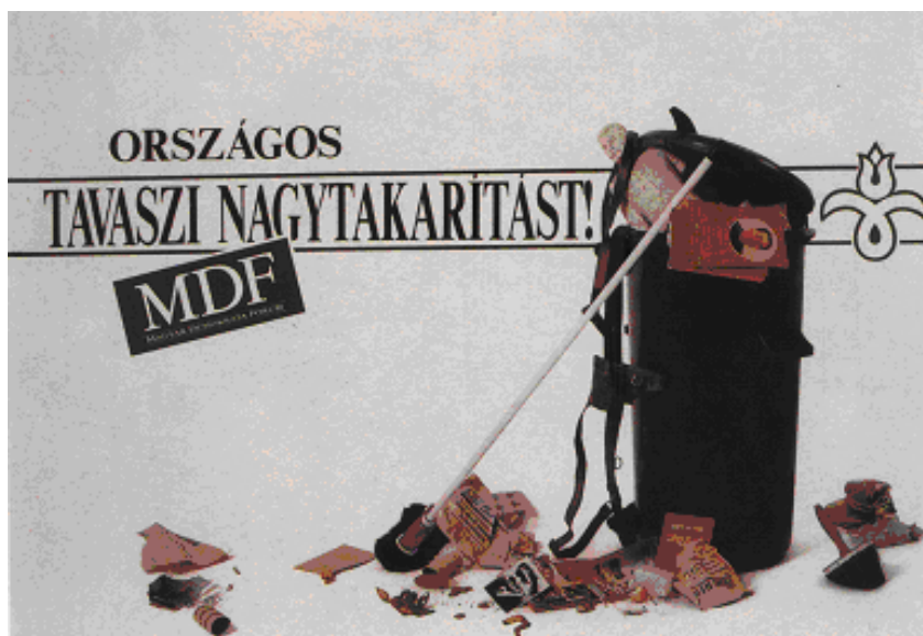
Béla Ábá: “Országos Tavaszi Nagytakarítást!”, Budapest 1989.

Todo lo que hacía referencia al “socialismo”, “comunismo”, “izquierda” o “marxismo” era considerado una rémora del pasado estalinista, una estafa macabra que debía ser descartada como la basura, tal como se muestra en el siguiente afiche del MDF: “Gran limpieza nacional de primavera” en donde puede verse un tacho de basura con una estatuilla de Stalin, el Libro Rojo de Mao, una fotografía de Lenin, el diario del Partido, una pistola representando a la represión y otros elementos del pasado dictatorial en Hungría.