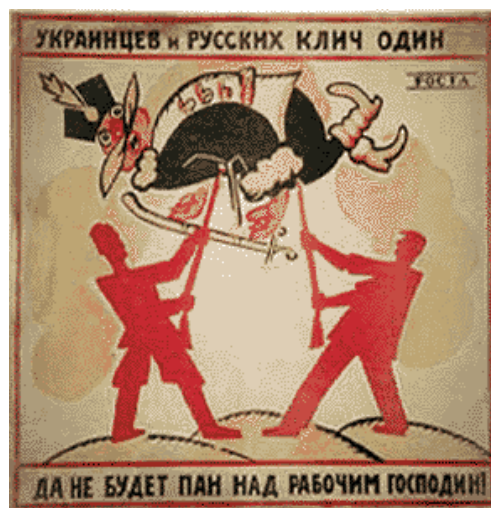
V. Mayakovsky: “No permitamos que los terratenientes gobiernen a los trabajadores”, Moscú c.1920.

cómo apreciar el arte” 3 , empleándose formas de expresión tanto narrativas como alegóricas. El afamado “poeta de la Revolución”, Vladimir Mayakovsky (1893-1930), fue un gran artista que también diseñó afiches como el siguiente que muestra a un terrateniente atravesado por las bayonetas de dos figuras rojas: