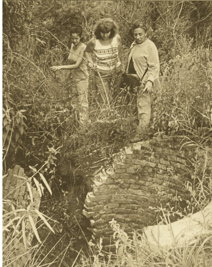
Imagen del CCD “La Casita de Mártires”