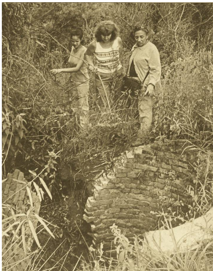
Imagen del CCD “La Casita de Mártires”