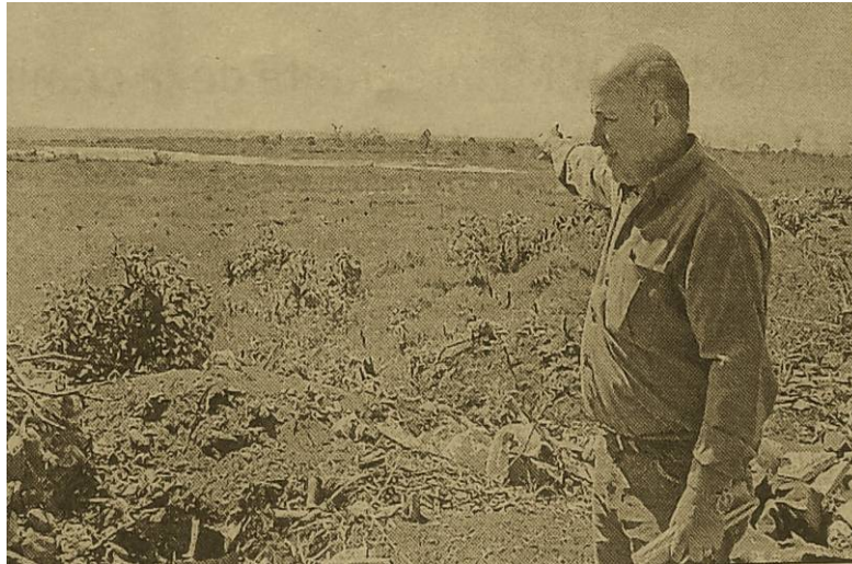
Imagen de la zona en que funcionó el CCD en cercanías del Club Rowing

“Los CCD de Misiones registrados en la Comisión Nacional son: El Escuadrón 8 “Alto Uruguay” de Gendarmería Nacional, la “Casita” cercana al Rowing Club de Posadas, el Servicio de Informaciones de la Policía Provincial, la Comisaría 1ª y la Delegación de la Policía Federal” 29 .