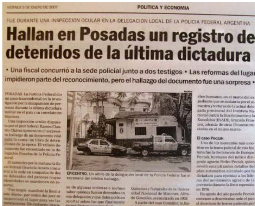
Imagen de la Delegación local de la Policía Federal, lugar que funcionó como CCD