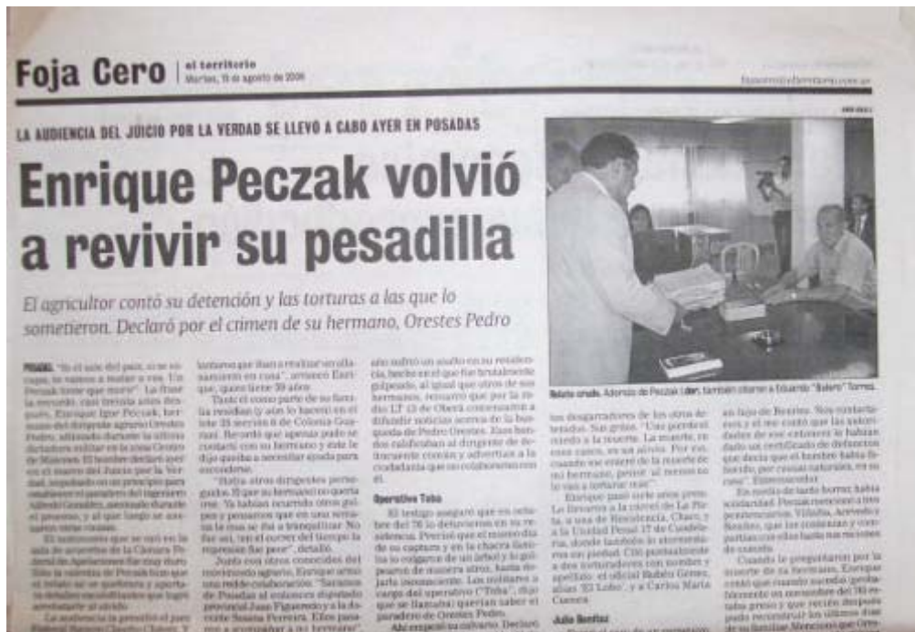
Imagen de una audiencia del Juicio por la Verdad – Juzgado Federal de Posadas

Los testimonios obtenidos en el marco de procesos judiciales, no son sustitutivos de las fuentes orales y su tratamiento hermenéutico plantea cuestiones teóricas y metodológicas particulares. Estamos en presencia de una memoria judicializada, que exige juramento de “verdad”. Jueces e Historiadores miramos al pasado-presente de modo diferente: