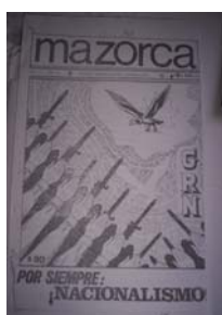
Figura 19: Mazorca , Nro 13, 1968 -tapa-. Donación.