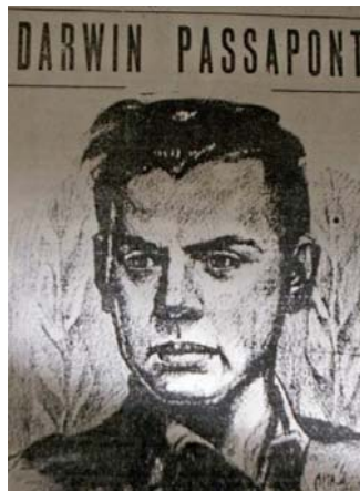
Figura 15: Publicado en Tacuara , vocero oficial de la UNES. La misma imagen sería posteriormente reproducida en Tacuara (MNT) y Mazorca (GRN), conservando todos y cada uno de los elementos que componen la imagen original.