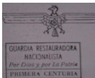
Figura 20: Mazorca , Nro 12, 1966 -contratapa-. Donación.