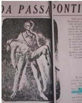
Figura 16: Publicado en Tacuara , vocero oficial de la UNES.