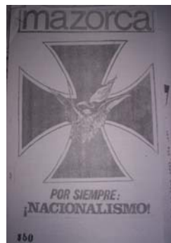
Figura 17: Mazorca , Nro 12, 1969 -tapa-. Donación.