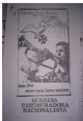
Figura 18: Mazorca , Nro 16, 1968 -contratapa-. Donación.