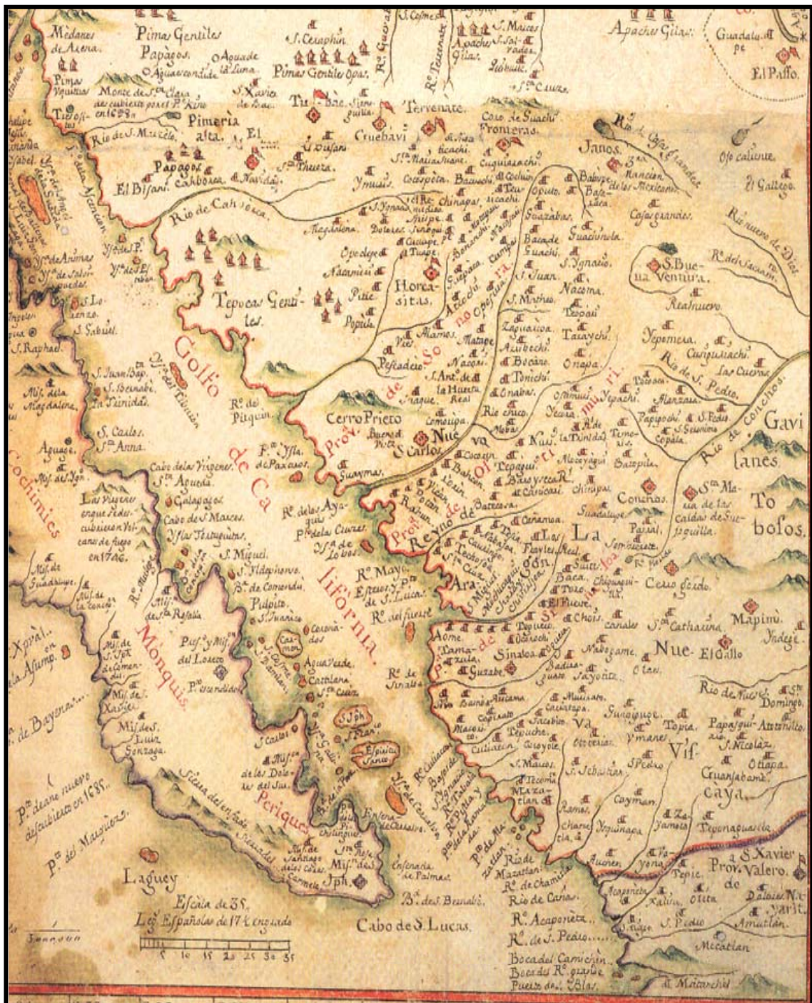
Mapa 4. Provincias de Sonora, Sinaloa y Ostimuri.