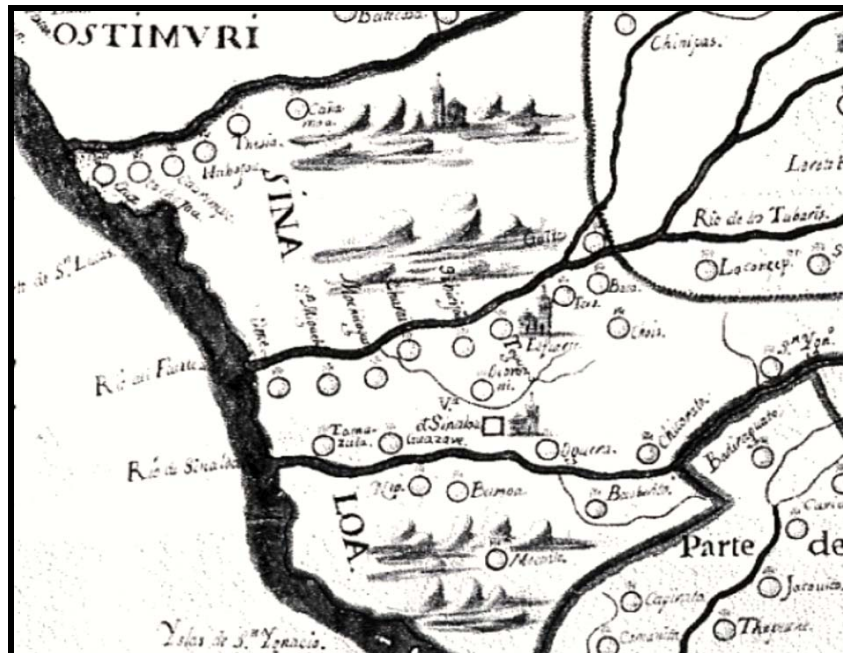
Mapa 2. Misiones del Río Fuerte