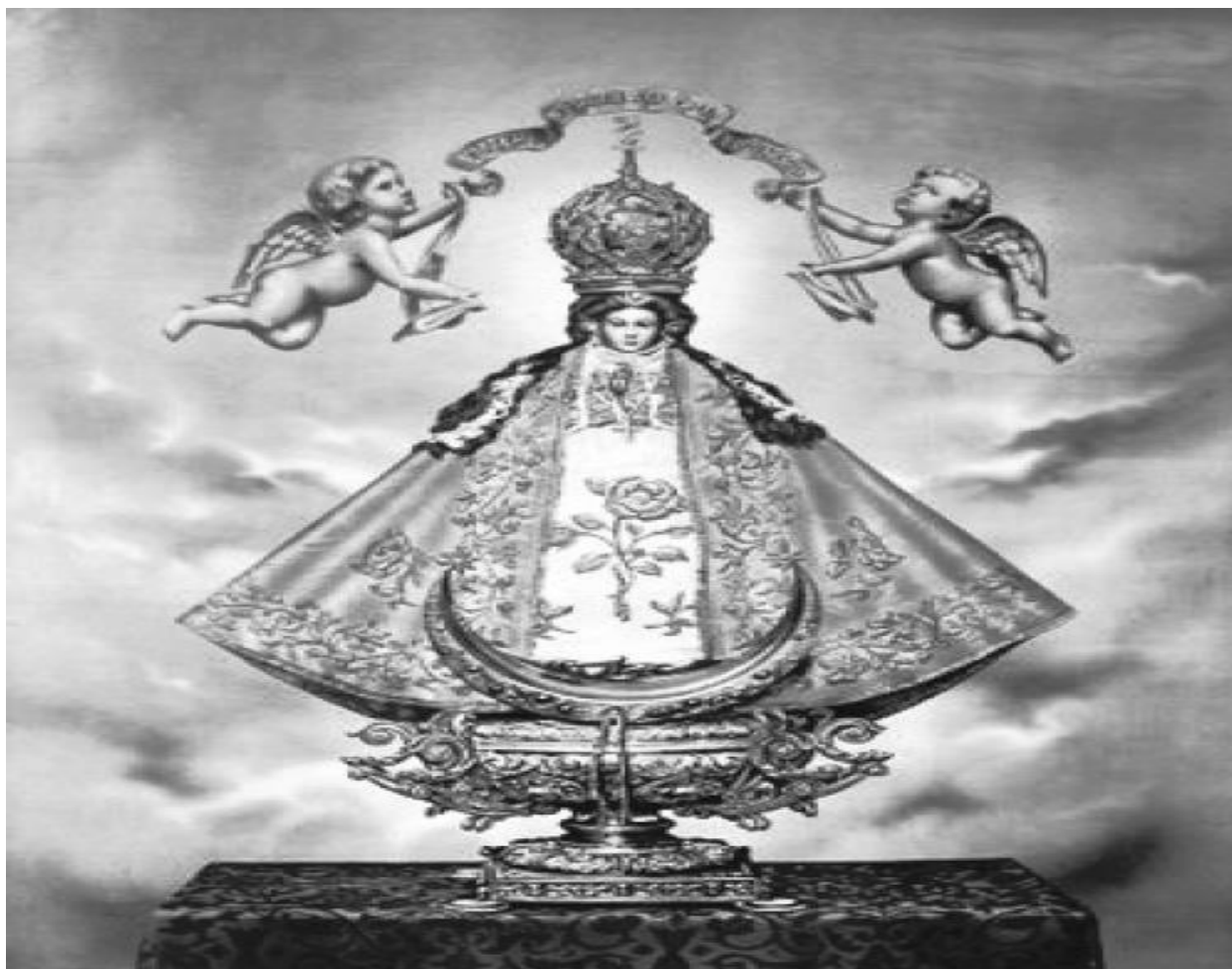
Imagen 1. Virgen de San Juan de los Lagos Jalisco, México.

Palabras Claves: Religión, peregrinación, Desarrollo, Proceso liminal.