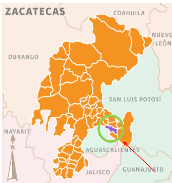
Mapa 1. Ubicación de Loreto Zacatecas.

La Concepción Loreto Zacatecas México, con clave de localidad 320240007 es una de las 83 localidades que se encuentran en el municipio de Loreto. Es una comunidad rural con una población total de 996 habitantes (INEGI 2010), de los cuales 503 son mujeres y 493 hombres. El consejo nacional de evaluación de la política de desarrollo social (CONEVAL), denomina el ámbito rural a aquellas localidades con menos de 2,500 habitantes.