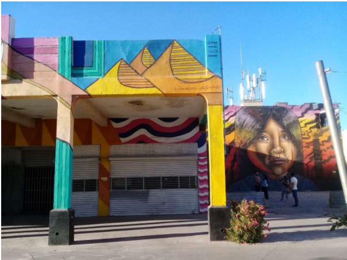
Figura 4. Fotografía del centro histórico