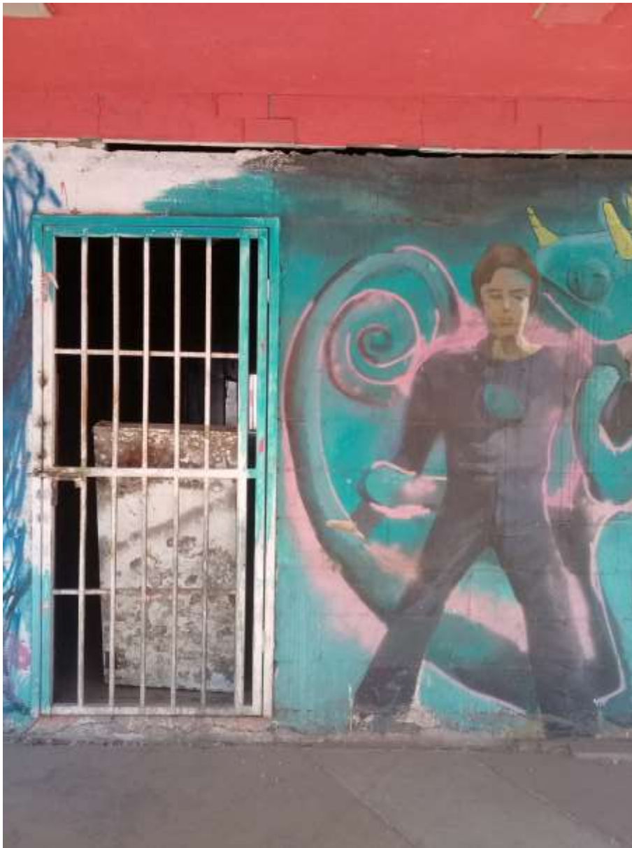
Figura 3. Fotografía del centro histórico de Mexicali. B. C,