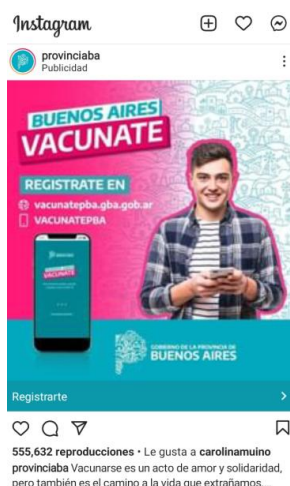
Vacunación a menores con donación/ Convocatoria publicitaria a vacunarse

231 Me gusta apepebahia EMPIEZA LA VACUNACIÓN DE MENORES DE 18 Mañana se van a distribuir 901.040 dosis de la vacuna #Moderna, del total de 3.500.000 que fueron donadas. Los criterios para vacunar a menores de entre 12 y 17 años son: