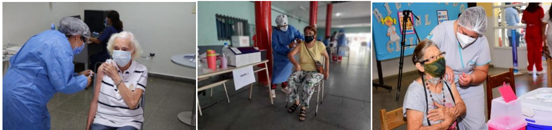
Vacunación por rango etario (mayores de 70)

Estos primeros tres grupos de fotos fueron los iniciales, pero luego en menor medida aparecieron otros grupos que tenían menor dimensión pero disputaban el poder: