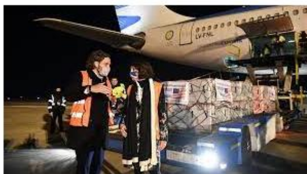
Recepción de vacunas donadas por EEUU

Hay una noción más aun en la donación y es el de la solidaridad, así la antropóloga brasileña Peirano (1996:15) 16 realiza en sus textos diálogos entre diversos aspectos de las ciencias sociales la que me interesa remarcar es la de Céli Regina Jardim Pinto, que piensa que con la teoría liberal que produce el sujeto político 'que coincide con el individuo', pero además sus textos ofrecen relacionar la política a la cultura y la ciudadanía en mosaico con la solidaridad. Y así proponerse desarrollar teoría de ¿qué tipo de sujeto construye la "solidaridad?" esta solidaridad también fue ejercida en algunos posteos bajo la leyenda “la salida es colectiva” “vacunarse es un acto de amor y solidaridad” que empezó a aparecer en mayor medida cuando las personas que se vacunaban eran cada vez menos y había que convocarlas.