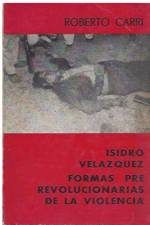
Imagen 2. Portada del libro Isidro Velázquez, formas prerevolucionarias de la violencia , Editorial Sudestada: 1968

También establece un diálogo crítico con el historiador Eric J. Hobsbawm quien había publicado el libro Rebeldes Primitivos. Estudio sobre las formas arcaicas de los movimientos sociales en los siglos XIX y XX (1968) en el cual hace un recorrido por las formas en el que campesino reacciona ante la exclusión, las relaciones y condiciones que propician el levantamiento de estos grupos sociales frente a la injusticia. 4 Carri plantea que no resulta adecuado el término de “bandolerismo” – en tanto hace aparecer a estas clases como “primitivas o prepolíticas” – y prefiere utilizar el término de “rebelde” para dar cuenta de la resistencia de la comunidad rural, reconociendo su potencialidad revolucionaria. 5 Sostendrá: “ Definir a un hombre como bandolero social no es la