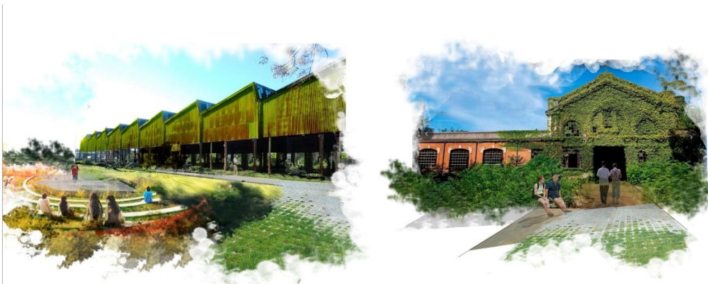
Fig.Nº19 / Propuesta de ambiente natural y refuncionalización