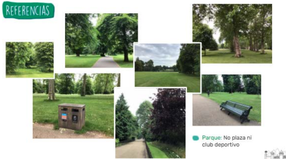
Fig.Nº16 / Referencias a tipos de parques abiertos, libres sin equipamientos y de bajo mantenimiento

/ Ambientales: referencias del tipo de parque, manteniendo, recuperando y fortaleciendo la flora existente.