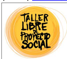
Fig. N°7 _ Logo del Taller Libre de Proyecto Social.

El TLPS está integrado por docentes investigadores y extensionistas de la Facultad de Arquitectura, Diseño y Urbanismo de la UBA, que llevan a adelante procesos formativos (con estudiantes de los últimos años de todas las carreras de proyectuales que se dictan en la FADU) y de investigación acción en territorio a partir de acuerdos de trabajo con organizaciones sociales, buscando poner desde la Universidad Pública sus conocimientos y actuaciones al servicio de las necesidades populares y comunitarias. Ver www.tlps.com.ar . Trabaja desde la escucha de las necesidades, y aporta satisfactores integrados a cada momento del proceso de acuerdo con las prioridades que define la organización.