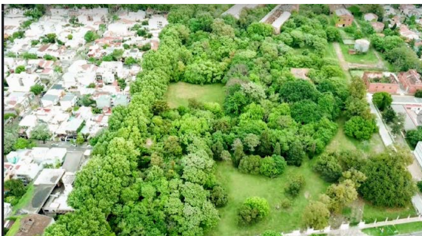
Fig. N°4 – Bosque urbano en su interior

/Ambientalmente, alberga un bosque urbano, uno de los últimos pulmones verdes de la localidad.