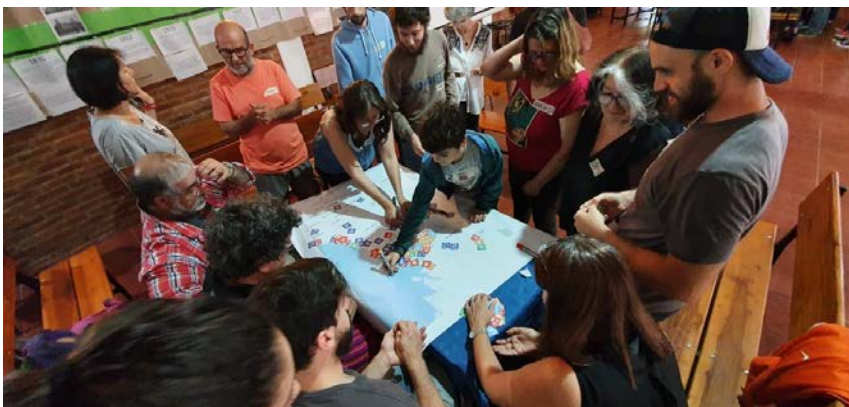
Fig. N°11 / primera zonificación de posibles actividades