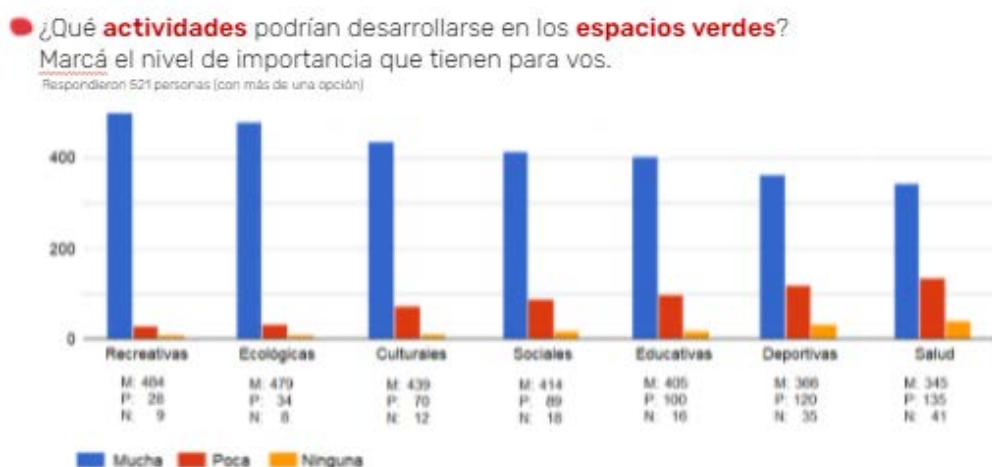
Fig.Nº13 / Actividades en espacios verdes

Participaron más de 500 personas y se recabo información sobre actividades y usos posibles en el predio. Compartimos algunos resultados