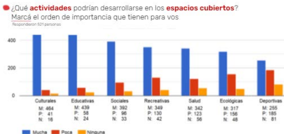
Fig.Nº14 / Actividades en espacios cubiertos

En relación a la consulta sobre destinar una parte del predio a viviendas sociales, preservando los espacios verdes existentes, el resultado fue 51 % a favor.