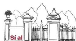
Fig. N°1 / Logo de la Asamblea