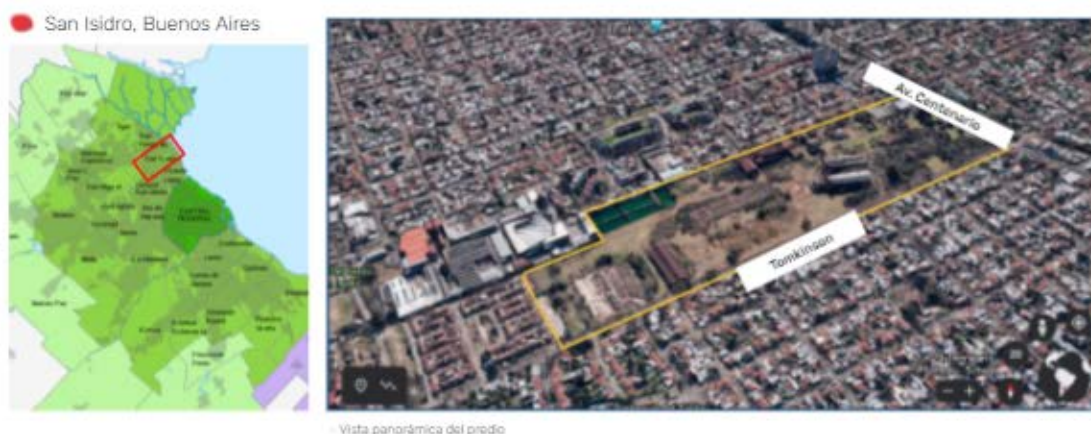
Fig. N°2. Localización del predio

El Proyecto es el momento actual de un proyecto-proceso de 25 años de lucha de defensa, recuperación y propuesta comunitaria de uso, de un predio de 19,5 has parte del que perteneció a la antigua Obras Sanitarias de la Nación, en Av. Centenario y Tomkinson, Béccar, Partido de San Isidro, a 24 km de la Ciudad Autónoma de Buenos Aires.