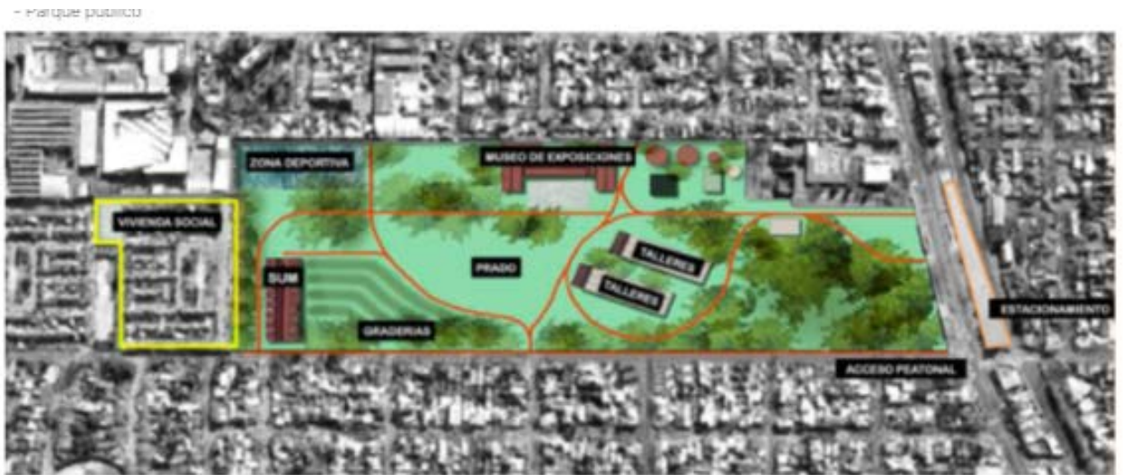
Fig.Nº18 / Esquema de zonificación propuesta

/ Esquema del anteproyecto indicando la zonificación en función de estos criterios