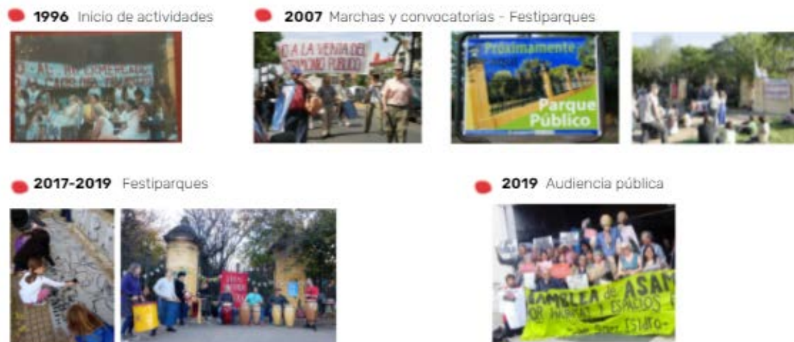
Fig. N°6 – Actividades de la Asamblea.

marchas, festivales, encuestas, campañas de difusión y firmas, taller participativo de anteproyecto, etc).