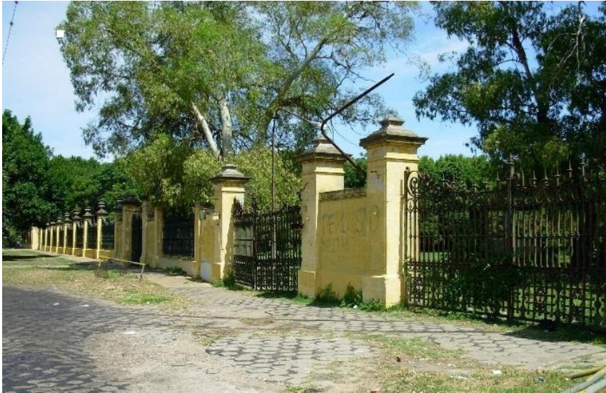
Fig. N°3 – Frente del predio.

/ Patrimonialmente, alberga edificios históricos tangibles de Obras Sanitarias de la Nación.