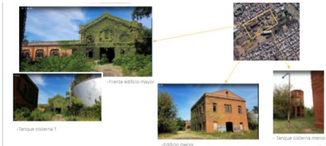
Fig.Nº17 / Edificios patrimoniales existentes en el predio

/ Patrimoniales: recuperación de edificios industriales para nuevos usos