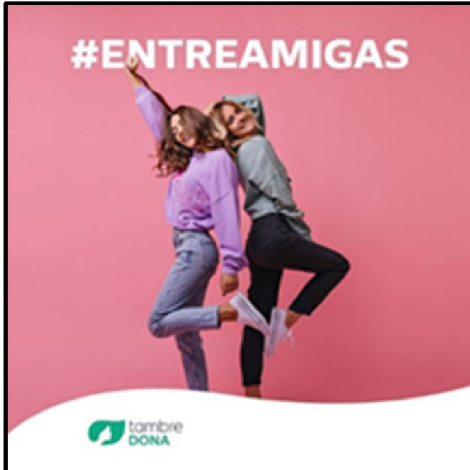
Imagen 10. Clínica reproductiva de España

Las publicidades que se presentan a continuación fomentan la colaboración entre mujeres, como un modo de asociar la donación de óvulos al sentimiento o pretensión de sororidad y participación en la demanda social de igualdad de género.