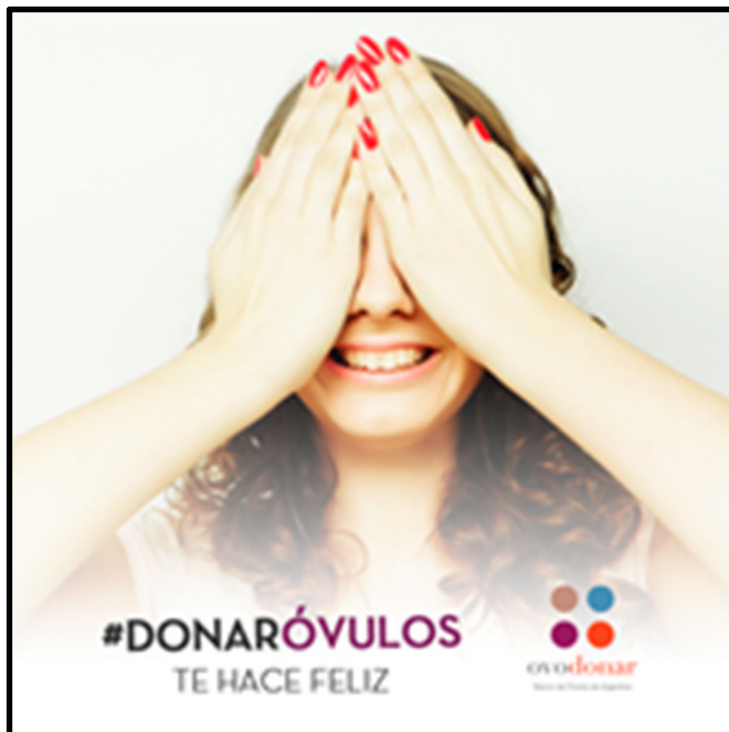
Imagen 5. Clínica reproductiva de Argentina