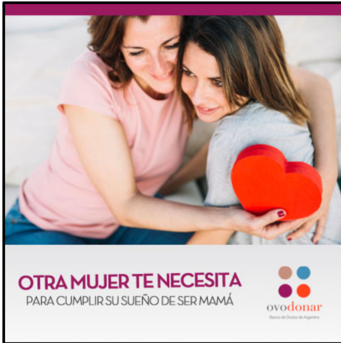
Imagen 11. Clínica reproductiva de España

La utilización del pronombre “te”, dirige de manera directa el mensaje a su receptora ideal, en este caso una futura ovodonante, esgrimiendo como argumento, nada más ni nada menos, que la necesidad: otra mujer te necesita. En la segunda parte del texto, vuelve a utilizarse el recurso de la maternidad equiparada a la realización de una mujer, al alcance de su anhelo más profundo.