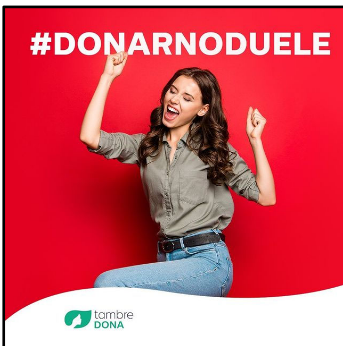
Imagen 13. Clínica reproductiva de España.

En la imagen 13 observamos a una mujer joven en una posición de festejo y alegría. La acompaña un hashtag: #DONARNODUELE.