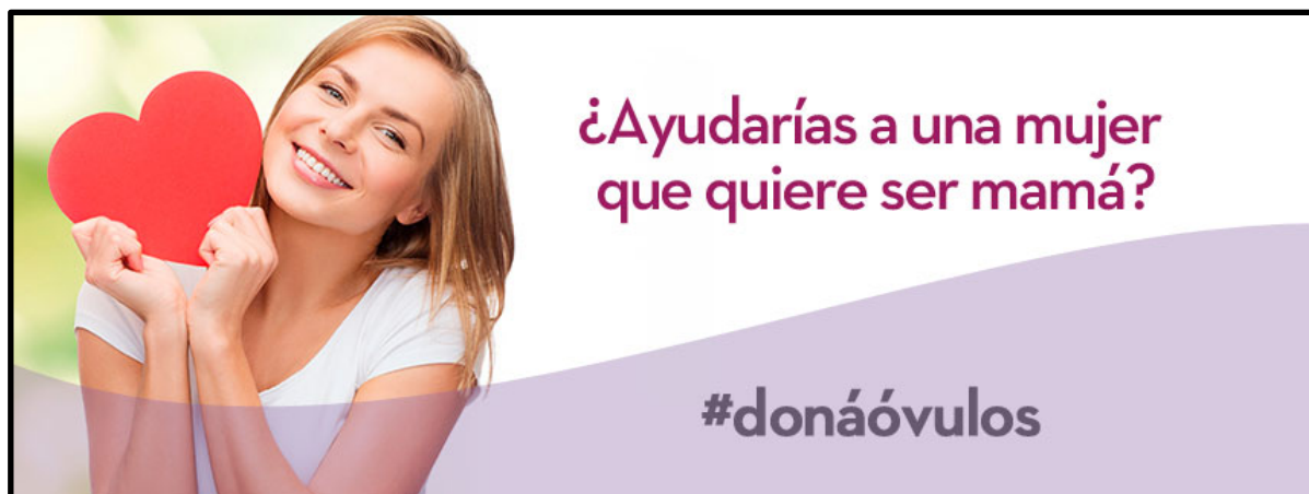
Imagen 1. Clínica reproductiva de Argentina

El mito mujer–madre es sostenido por la sociedad patriarcal, que naturaliza el deseo de ser madre para toda mujer. Sostiene que la identidad de la mujer pasa, necesariamente, por un punto de identificación al ser madre, que contribuye, además con la visión altruista que fomenta el compromiso “entre mujeres” para ayudarnos a alcanzar este ideal común.