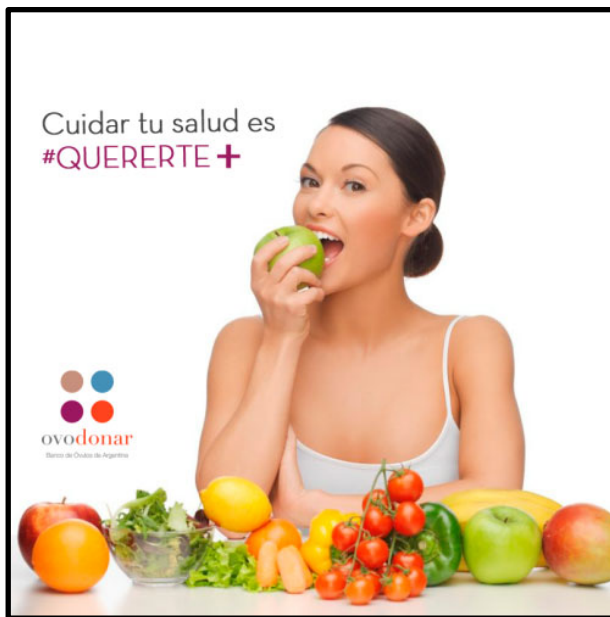
Imagen 7. Clínica reproductiva de Argentina

Dieta, ejercicio y buenos hábitos son modos en los que se elige enviar un mensaje de autocuidado y amor a sí misma.