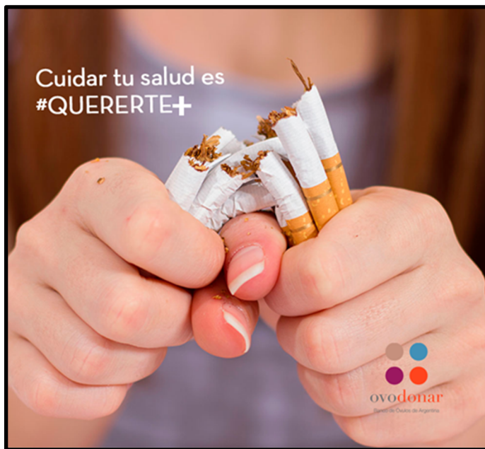
Imagen 8. Clínica reproductiva de Argentina

La imagen 9 muestra a una mujer realizando ejercicio, en una posición en la cual se destaca la tonicidad de los músculos en el trabajo. Su mirada demuestra concentración en la tarea que realiza. Lleva ropa deportiva, ceñida a su cuerpo y un peinado cuidado y prolijo. Esta imagen también pertenece a la campaña con el lema "Cuidar tu salud es quererte +".