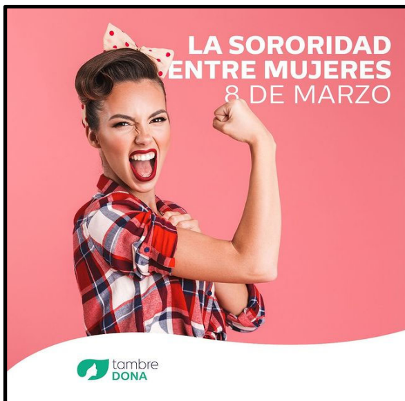
Imagen 12. Clínica reproductiva de España.

La utilización del pronombre “te”, dirige de manera directa el mensaje a su receptora ideal, en este caso una futura ovodonante, esgrimiendo como argumento, nada más ni nada menos, que la necesidad: otra mujer te necesita. En la segunda parte del texto, vuelve a utilizarse el recurso de la maternidad equiparada a la realización de una mujer, al alcance de su anhelo más profundo.