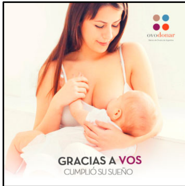
Imagen 2. Clínica reproductiva de Argentina

El hashtag #donáóvulos en color violeta y fondo lila, le ofrece a la imagen total, un apartado centrado en colores más opacos. La utilización de las tildes en esta herramienta virtual de indexado, prioriza el modo imperativo del verbo a la facilidad de acceso a través de los vínculos de búsqueda en las redes.