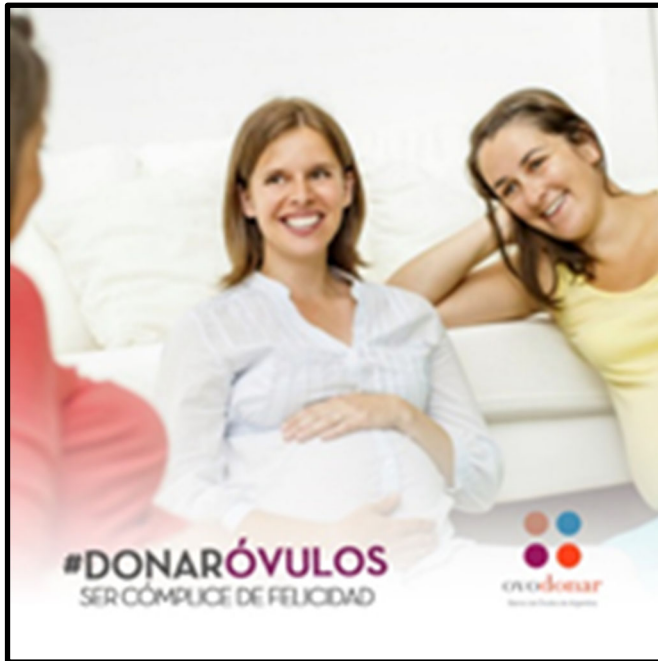
Imagen 4. Clínica reproductiva Argentina

En la imagen 4, si bien se muestran en total tres mujeres, solo se les ve la cara a dos de ellas. Quienes están de frente, son mujeres blancas, mirando y sonriendo a la tercera mujer, desconocida.