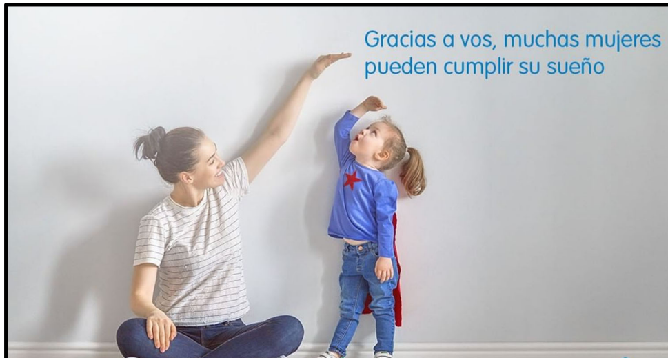
Imagen 3. Clínica reproductiva Española presente también en Argentina

La imagen 3 ya no muestra a un bebé, sino a una niña de edad pre escolar, vestida de superheroína, que mira hacia arriba con cara de asombro. A su lado, una mujer en jeans y remera, con una actitud relajada. Si bien esta interactúa con la niña- levantando su mano para medir una altura que ella observa- no deja de mirarla a ella.