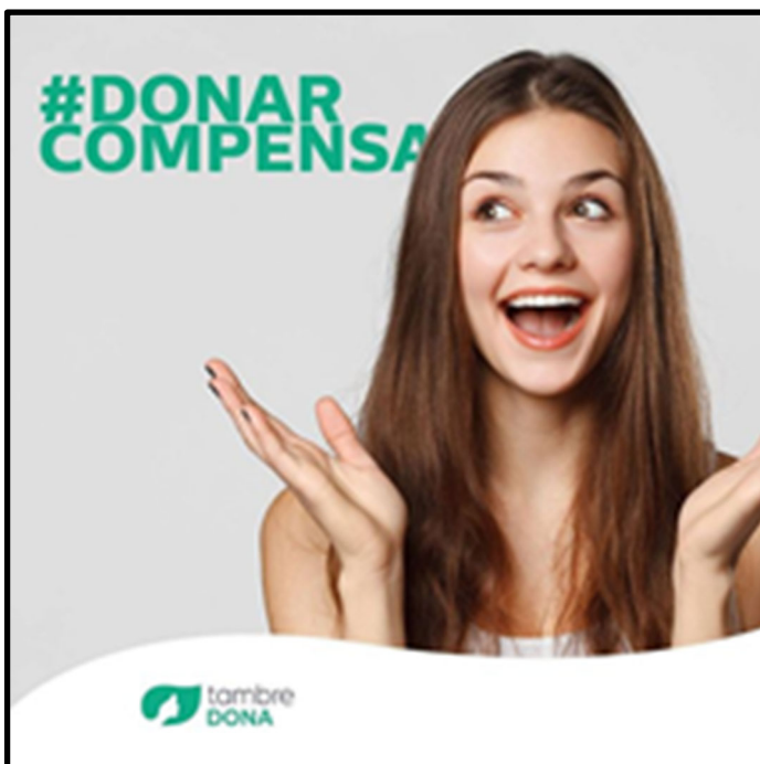
Imagen 14. Clínica reproductiva de España.

En la imagen 14 observamos a una mujer joven y hegemoníicamente bella, sonreír y gesticular con sus manos en señal de sorpresa. A su lado un hashtag cita: #DONARCOMPENSA.