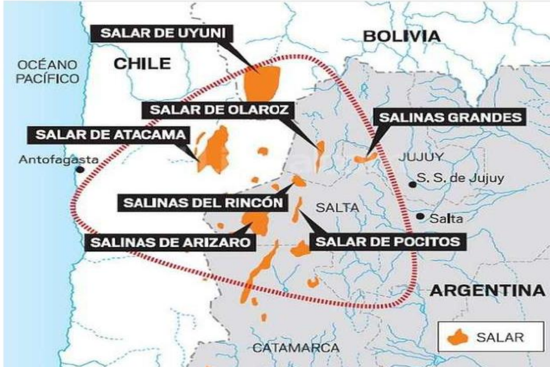
Gráfico N°1: El triángulo del litio (Argentina-Bolivia-Chile)