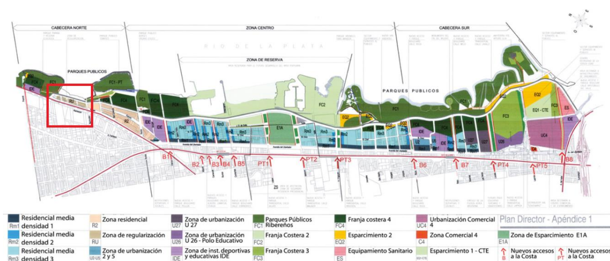
Figura N°1: Plan Director para el área ribereña del Partido de Vicente López, año 2006. Recuadro rojo con la ubicación del Barrio El Ceibo. Intervención de la autora de este ensayo para identificar el Barrio El Ceibo.

En la Figura N°1 se observa en un recuadro rojo la ubicación del barrio el Ceibo como Zona de Regularización, RU, que aún no ha sido regularizada y que, hasta el año 2020, el municipio no cuenta con planos o catastros actualizados. Su localización en la Ribera Norte del Área Metropolitana, en el bajo del Partido y sobre la costa del Río de la Plata, le brinda características específicas en relación con el riesgo de inundaciones producto de fuertes precipitaciones o de eventos de sudestada.