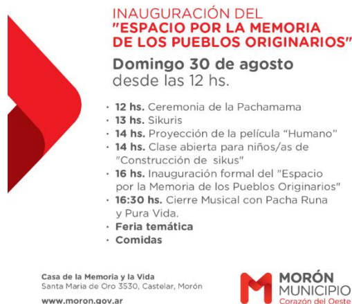
Imagen N°: Imagen de difusión e invitación a la jornada de inauguración del EMPO.