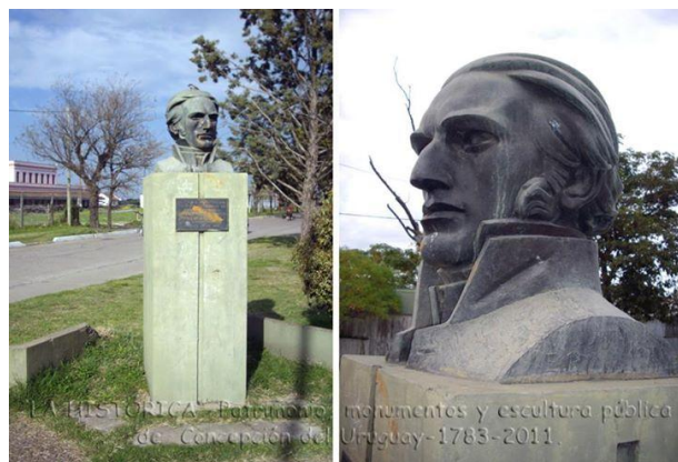
Monumento a Santiago Artigas - Cementerio viejo de Concordia