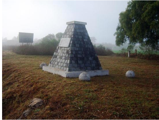
Combate del Espinillo – Arroyo homónimo – departamento Paraná