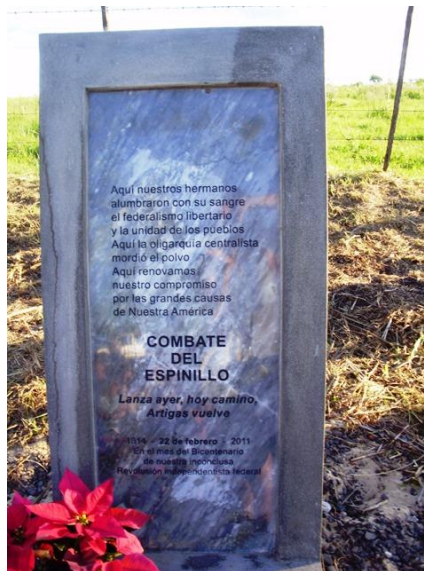
Combate del Espinillo – Referencias en La Picada