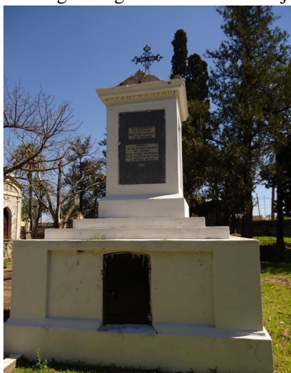
Éxodo Oriental – Ayuí – Concordia