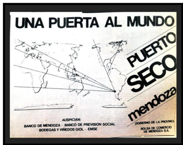
Imagen 2: Anuncio publicitario en Diario Mendoza

En la actualidad, en el Corredor Bioceánico Central se suman y complementan redes camineras, sistemas ferroviarios y ríos navegables. El paso cordillerano Cristo Redentor, encuentro del sistema de la Ruta Argentina N° 7 y de la Chilena N° 60, es la histórica, actual y operable vinculación de un gigantesco espacio económico cuyo hinterland comprende el sur de Brasil, pasando por Paraguay, Uruguay y todo el noreste argentino hasta, lógicamente, las economías regionales de Cuyo. Mientras que su foreland incluye Centro y Norte de América, Oceanía, Asia, África y Europa, tal como lo comunicaba el gobierno provincial en 1986 con la inauguración de las obras de la Zona Primaria Aduanera (imagen 2).