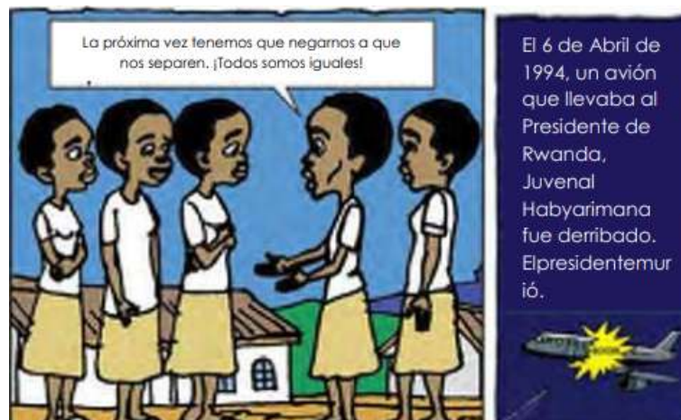
Página 4, recuadros 1 y 2 (Novela gráfica "Tugire Ubumwe")

Por otro lado, en la novela la muestra a Sylvie estando en la escuela primaria, resistiéndose a la práctica de ser divididas en grupos según las etnias. Luego presente el hecho histórico del derribe del avión que trasladaba al presidente Habyarimana.