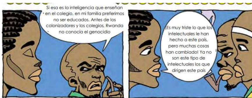
Página 15, recuadros 4 y 5 (Novela gráfica "Tugire Ubumwe")