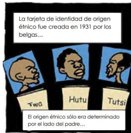
Página 2, recuadro 1 (Novela gráfica "Tugire Ubumwe")

En relación a las causas, en la novela gráfica se hace referencia a la colonización belga y su política de dividir a la sociedad en grupos étnicos, demarcados mediante la emisión de tarjetas de identidad.