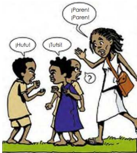
Página 7, recuadro 5 (Novela gráfica "Tugire Ubumwe")

que surjen entre ellos mismos y que Sylvie aprovecha para enseñar lecciones sobre discriminación y racismo.