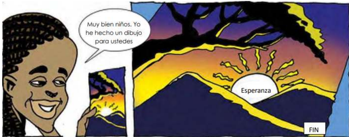
Página 28, recuadros 5 y 6 (Novela gráfica “Tugire Ubumwe”)

Finalmente, los alumnos imaginan su futuro distinto a como lo habían imaginado antes: Tugiere piensa ser presidente de Ruanda, Ubu quiere ser maestra y Mwe se imagina siendo doctor. Por tal motivo, Sylvie les regala un dibujo para ellos con un mensaje: “Esperanza”.