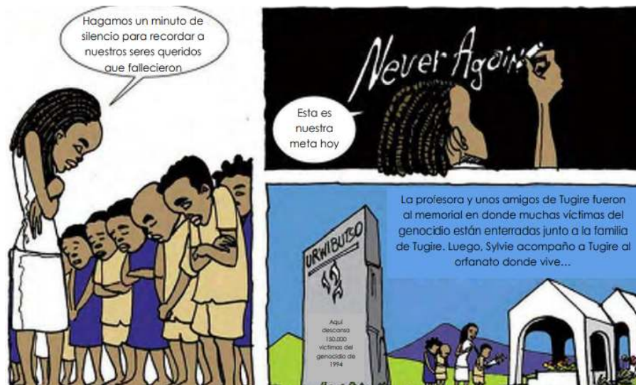
Página 22, recuadros 4, 5 y 6 (Novela gráfica “Tugire Ubumwe”)

En este caso, el relato sobre el genocidio revaloriza la noción de “Nunca más” alentando a que nunca más sucedan estos acontecimientos. A su vez, le da importancia a los sitios de memoria que se han ido construyendo a lo largo del territorio ruandés con el objetivo de recordar a las víctimas y dejar intactos esos espacios en los que ocurrieron las masacres.