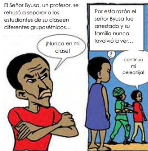
Página 3, recuadros 4 y 5 (Novela gráfica "Tugire Ubumwe")

Se puede observar que el padre no es arrestado por ser miembro de alguna etnia en particular, sino por la resistencia a dividir a su grupo de estudiantes en diferentes etnias. Se deja entrever que existe una idea de unidad, de nación preexistente a la división por parte de los belgas y que por eso no se los quiere dividir. Además, se puede ver que el relato de la novela toma la noción de que luego de la caída de la administración belga, el gobierno nacionalista no impugnó, más bien reprodujo las divisiones legales de las etnias hutu – tutsi (Mamdani, 2003).