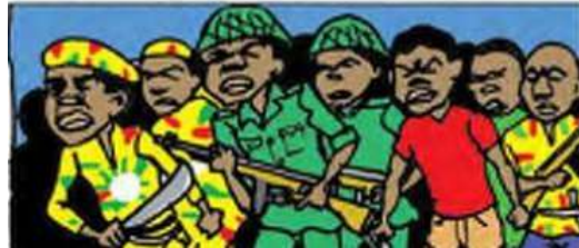
Página 4, recuadro 3 (Novela gráfica “Tugire Ubumwe”)