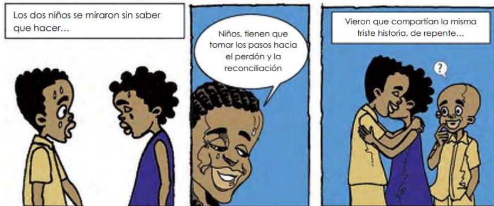
Página 13, recuadros 1, 2 y 3 (Novela gráfica "Tugire Ubumwe")

Otra mirada sobre el futuro la da Sylvie luego de que sus alumnos Tgire y Ubu se pelearan. Cuando ellos se dieron cuenta de que ambos sufrían secuelas del genocidio, la docente los invitó a perdonarse y reconciliarse.