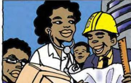
Página 16, recuadros 1 y 2 (Novela gráfica "Tugire Ubumwe")