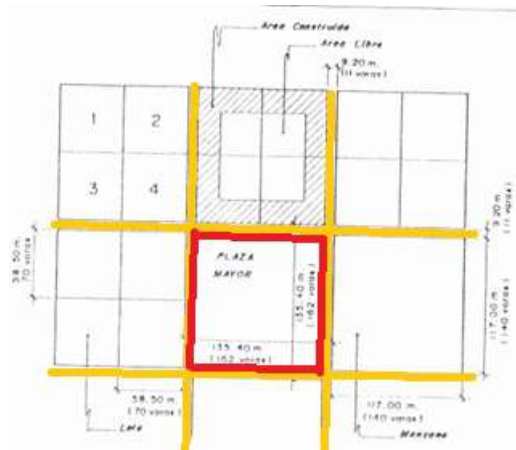
Figura 1. Reinterpretación de esquema ideal de la división predial y la implantación edilicia del periodo colonial. Fuente: Tipologías arquitectónicas del Centro histórico de Sucre -Plan de Rehabilitación de las Áreas históricas de Sucre. 1997.

Así mismo las Cédulas Reales y Ordenanzas, establecidas en las Leyes de Indias de 1576 incorporan la estructura de damero como modelo urbano en la Plata.