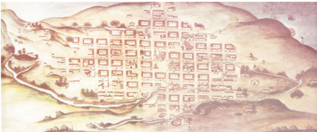
Figura 2. Plano de La Plata por Idefonso Lujan.

Así mismo Wolfgang, retomando lo escrito por varios autores dice: En el año de 1540, 34 solares (o cuartos de manzana), es decir 8 \frac{1}{2} manzanas se hallaban distribuidas. Con ocasión de la visita del virrey Francisco de Toledo 1572-1574, la ciudad debió abarcar por lo menos las iglesias y conventos, cuya construcción ya había empezado en esta época, pudiendo determinarse, desde San Lázaro hasta Santa Bárbara, cierto desarrollo longitudinal entre los dos riachuelos del interior de la ciudad. Sin embargo, ya en 1639 debe haber existido el trazado colonial en forma de un rombo más o menos regular, tal como se representa en 1777 por Lujan. (Wolfgang y Márquez, 1974)