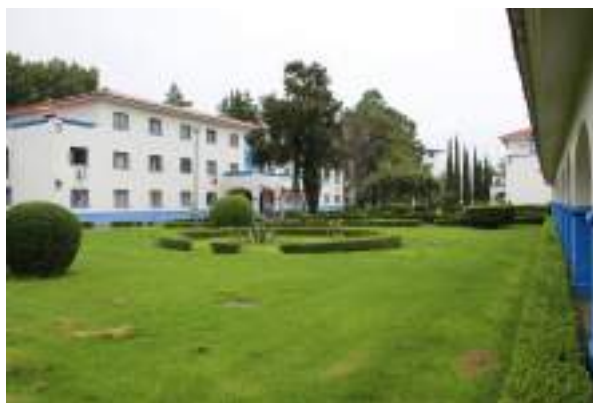
Figura 2 Departamento de Internado de la UACH.

Por sus orígenes, en esta institución sus alumnos cuentan con educación gratuita, becas y servicios asistenciales.