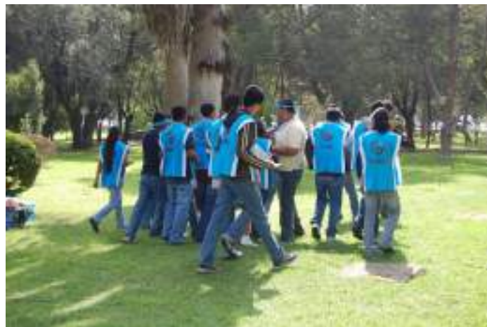
Figura 4 Actividades de integración

Sin embargo, la situación de la UACH, no es aislada, por ejemplo, dentro de las funciones de la Comisión Nacional de los Derechos Humanos (CNDH), (Principal órgano de atención a los Derechos Humanos en México), son, la atención y seguimiento de quejas y emitir recomendaciones.