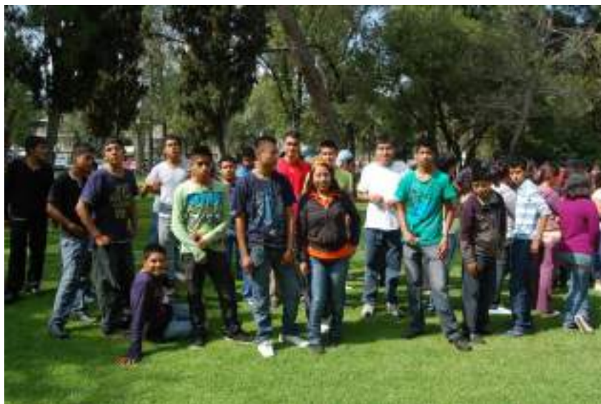
Figura 3 Alumnas y alumnos de nuevo ingreso 2018.

Los criterios antes mencionados, por lo general cumplen un patrón de relación, pueblos indígenas y municipios pobres, sin embargo, permiten el ingreso de estudiantes de regiones marginadas e indígenas del país y que haya, proporcionalmente, más estudiantes indígenas que en otras instituciones de enseñanza del mismo nivel, en México y el mundo.