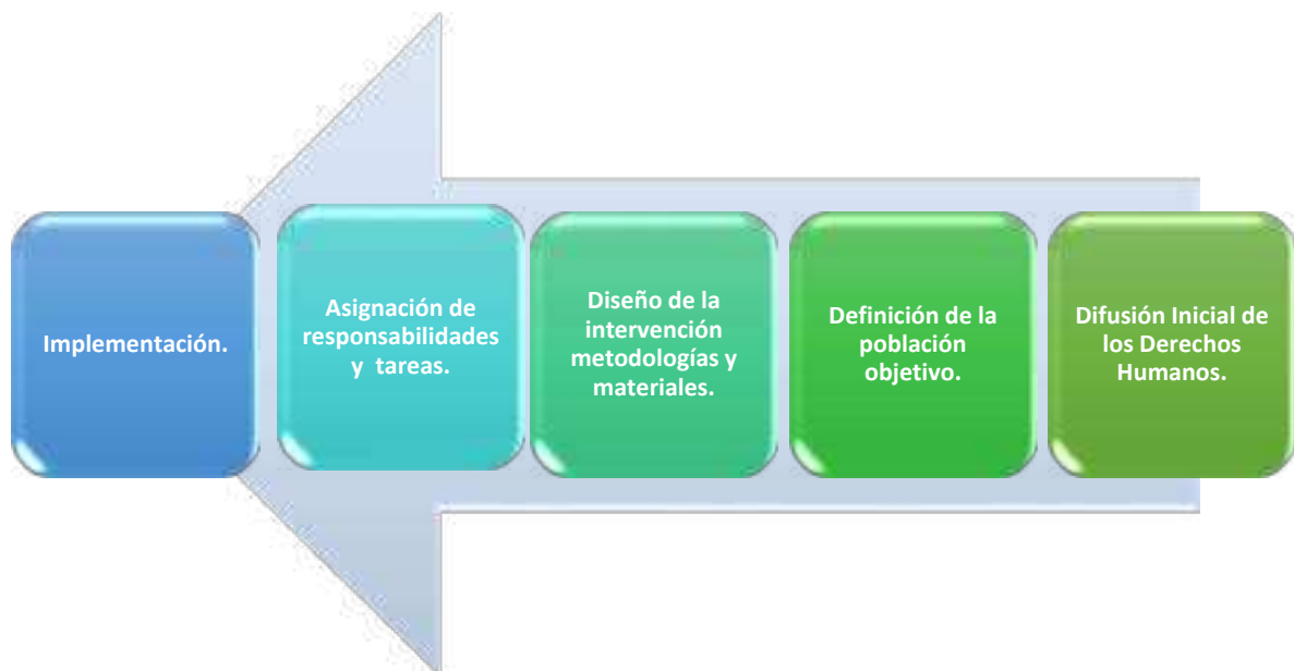
Figura 7 Esquema de la Etapa B

Al momento se han desarrollado dos guiones y dos vídeos que se han difundido principalmente en los estudiantes de la Preparatoria Agrícola.