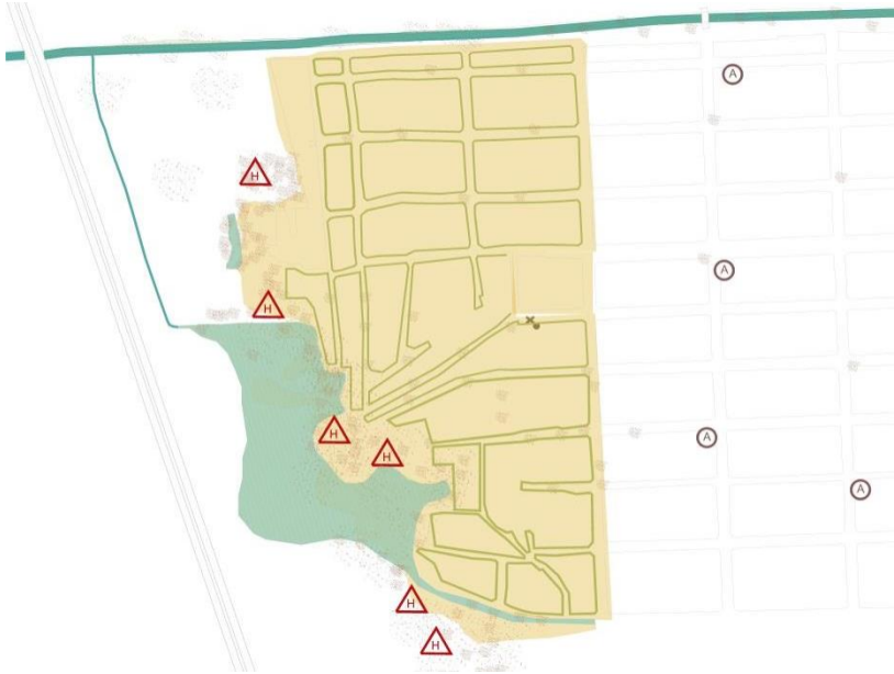
Img 3: producción urbana y residuos