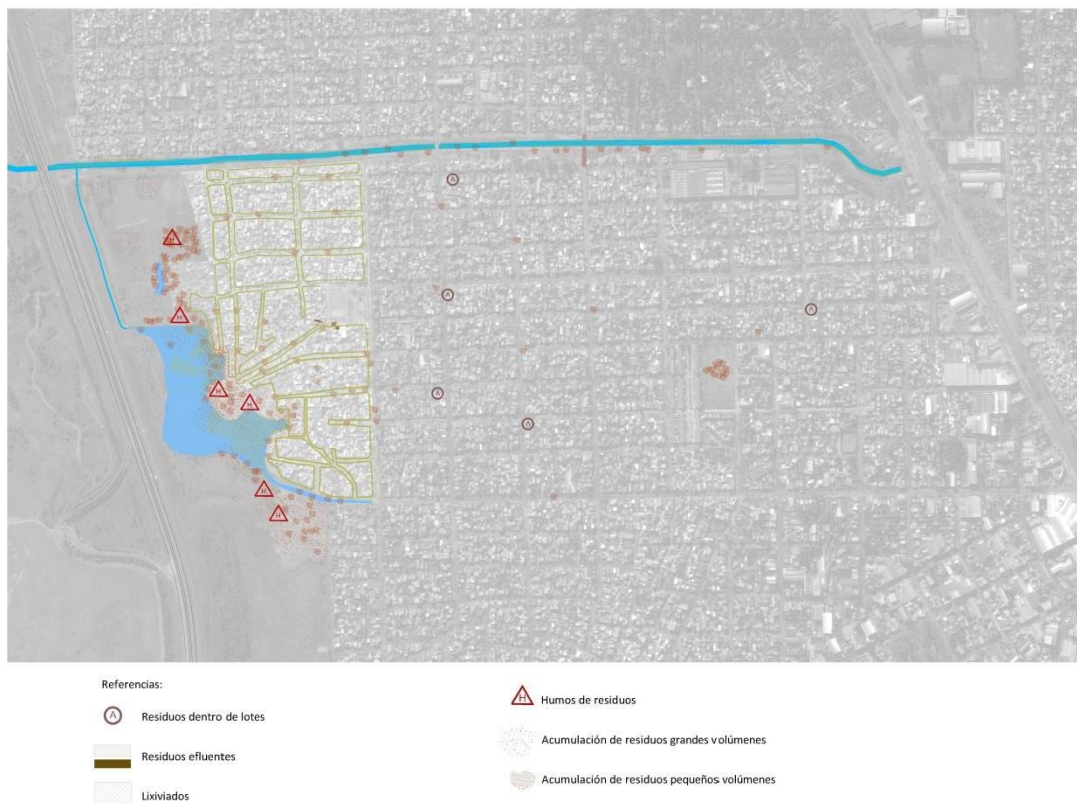
Img 2: Residuos en Costa del Lago, 8 de mayo y barrio Libertador

Como mencionamos, partiremos del estudio cartográfico y de observaciones de las configuraciones territoriales en el barrio (Rodríguez 2018), realizado mediante cartografía satelital, noticias, seleccionando información de mapeos colectivos realizados en el barrio e información del relevamiento físico.