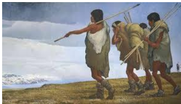
Imagen de los primeros hombres/mujeres.