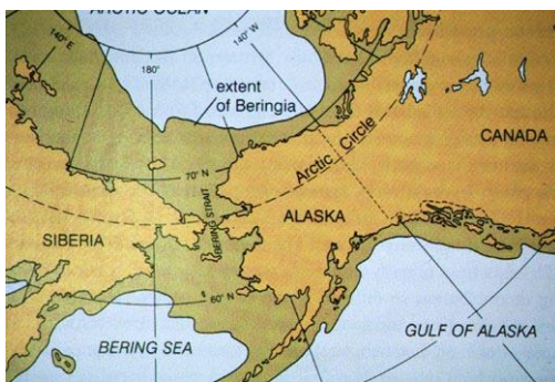
Corredor de Beringia.