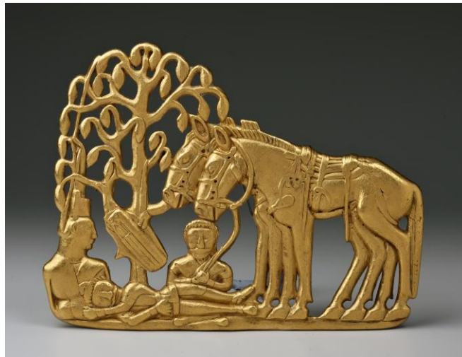
Plaqueta de oro Saka, siglos V-IV a.C

interpretación de la escena representada en la plaqueta de oro conservada en el museo Hermitage de San Petersburgo.