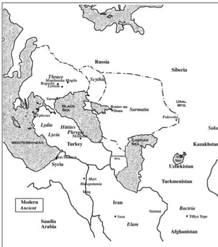
Tripartición de Scythia

El producto de las excavaciones, complementado con la información suministrada por las fuentes escritas clásicas y persas, permitió deslindar una tripartición del inmenso territorio que abarcaba Scythia , distinguiéndose tres grandes grupos culturales dominantes: los Escitas Occidentales, ubicados en la región del Ponto Euxino, los Sauromatas-Sarmatas del Cáucaso y la confederación Saka, que ocupaba el oriente de la región.