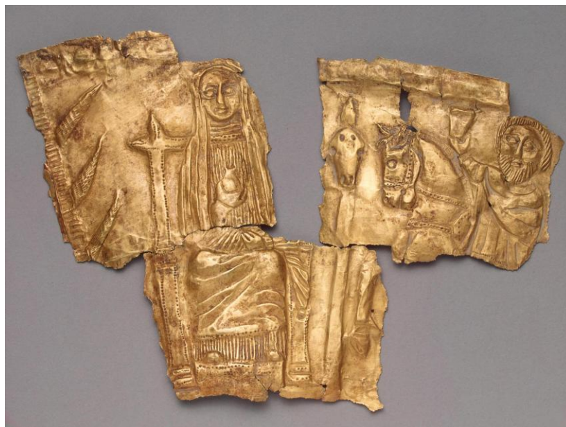
Fragmento del rhyton de Merdzhany

En esta primera parte de la composición aparecen características que permiten asociar a la Dama con el arquetipo del árbol cósmico –de la vida y del conocimiento-, pero lo que resulta particularmente interesante es la descripción que se ofrece sobre la misma, que bien refleja una epifanía: “ It was a tree and yet not a tree, a person and yet not a person ” 11 .