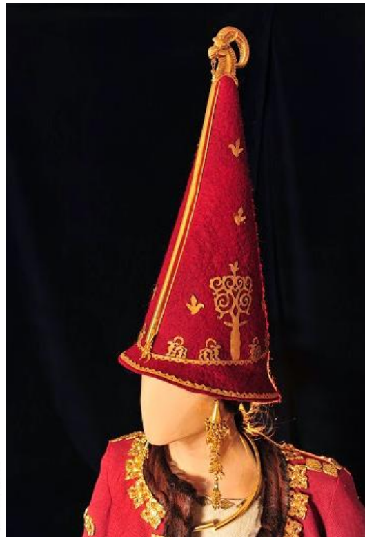
Kulakh de Issyk y Kulakh de Terekty