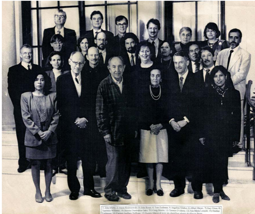
Simposio Variations in the Expression of Inka Power . Dumbarton Oaks, 1997

primer lugar, por la revisión de la cronología de la expansión incaica a partir de evidencia arqueológica -poniendo en discusión la cronología corta basada en documentos-; y, en segundo lugar, por el interés en las distintas estrategias que, de acuerdo a la variedad de situaciones locales, se implementaron en dicha expansión.