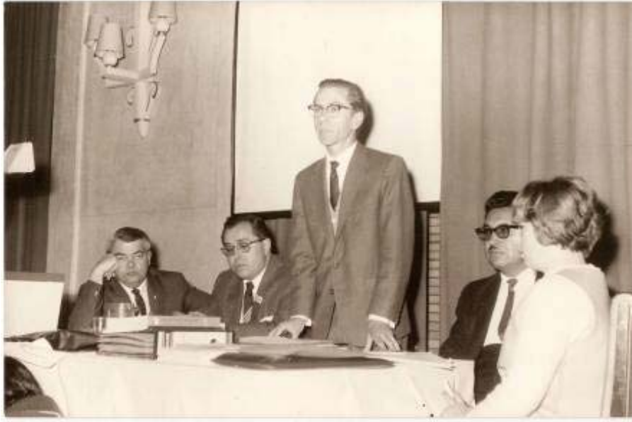
XXXVII Congreso Internacional de Americanistas, Mar del Plata, 1966