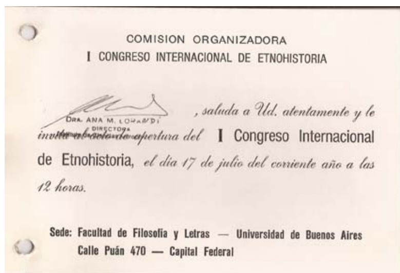
Esquela de invitación al I Congreso Internacional de Etnohistoria

Aunque en buen estado general, el material relativo al I CIE se encontraba guardado precariamente y corría riesgo inminente de deterioro debido a que sus condiciones de almacenamiento no lo protegían contra agentes químicos y biológicos nocivos como tampoco contra cualquier error humano que pudiese dañarlo. En vista de lo anterior, una segunda tarea consistió en realizar una identificación, organización y conservación más adecuada del mismo. Sin embargo, en un futuro inmediato se precisa avanzar también en una intervención definitiva que asegure su conservación acorde a la relevancia que posee.