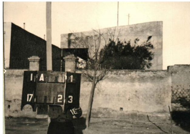
Dorso y fotografía de la ficha catastral correspondiente a un inmueble ubicado en Casanova 367