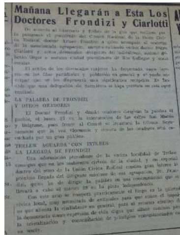
Figura 1: Recorte de la llegada de Frondizi y Ciarlotti a la ciudad en 1952.