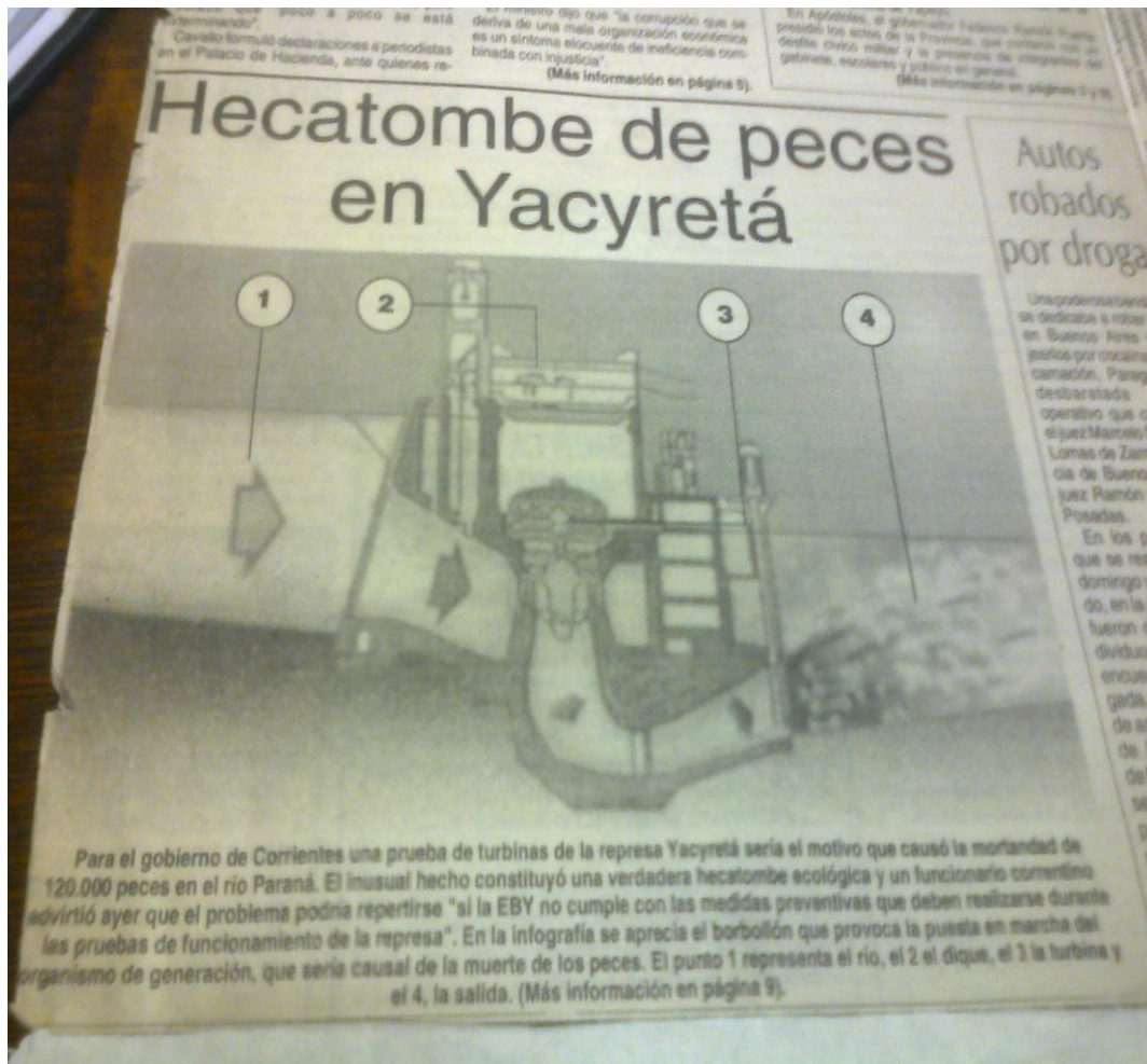
Ejemplar del diario El Territorio del jueves 18 de agosto de 1994. Nota de tapa.

Asimismo, a fines de agosto de 2001 se afirmó que el traslado de yacarés de las zonas inundadas de Paraguay a las reservas de Yacyretá e Itaipú se realizó porque los mismos se encontraban moribundos “por falta de alimento” 20 .