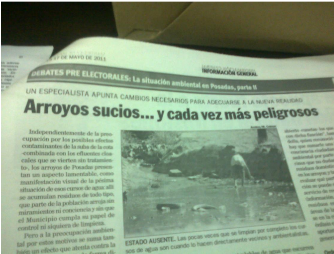
Noticia del 17 de mayo de 2011. Primera Edición.