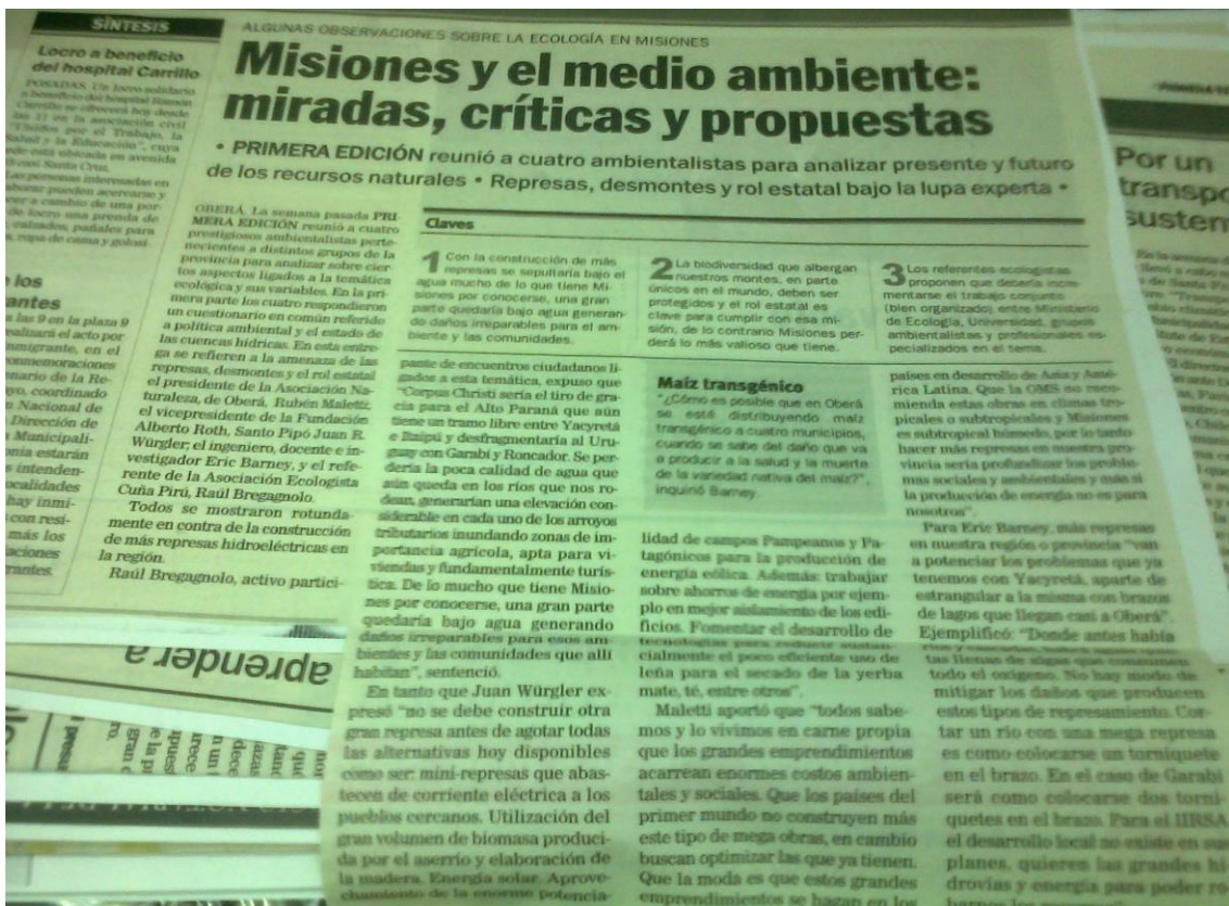
Entre los problemas ambientales, se señala a las represas hidroeléctricas. Primera Edición, 17 de mayo de 2011.