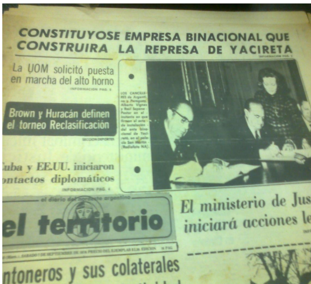
Publicación del diario El Territorio del 7 de septiembre 1974 sobre la conformación de la EBY.

Si bien el Tratado para la construcción de Yacyretá se firma en diciembre del año 1973, es en septiembre del año siguiente que se conforma la Entidad Binacional Yacyretá. El 8 de octubre de ese año, el Concejo Deliberante de la ciudad de Posadas sancionó un decreto en el que se estableció la prohibición de innovar, esto es, no se podía construir ni vender, aquellos terrenos que se encontraban ubicados sobre la orilla del río Paraná. Posteriormente, se procedió a censar a la población asentada sobre las tierras que serían inundadas con la construcción de la represa.