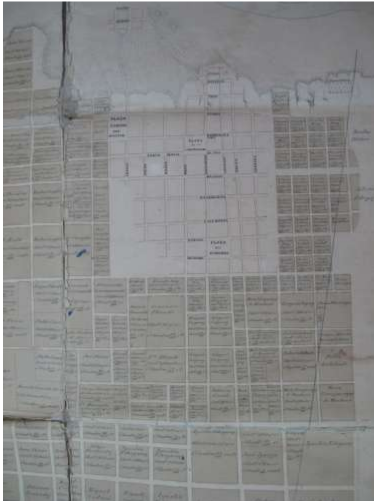
Sector del registro gráfico del pueblo y ejido de Baradero. Germán Kuhr, 1857.

La traza definitiva del pueblo y el ejido, fue realizada por Germán Kuhr en 1868 y 1872, a pedido del Departamento Topográfico 49 .