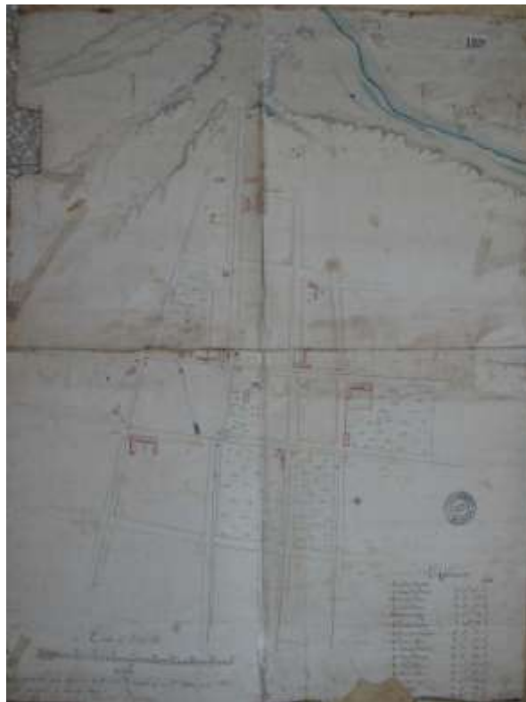
Plano del Pueblo de Baradero. Agrimensor José María Manso. 1828

Hasta que los agrimensores sumaron a su función la de “jueces de mensura”, al agregarse la citación de linderos 30 .