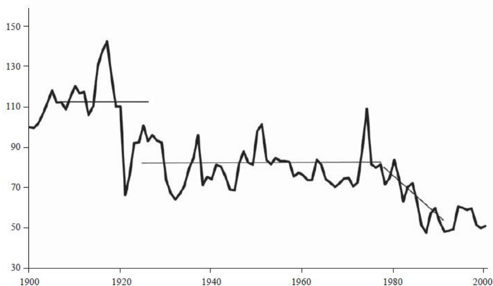
Gráfico 1: Índices de precios de productos básicos no petroleros (1900 = 100)

brusca y de gran magnitud de la que no se recuperaron en las décadas posteriores. En cambio en 1979 no hubo una caída brusca de los precios, sino más bien un quiebre en su tendencia, que a partir de entonces se torna fuertemente negativa. En conclusión, diversas pruebas permiten establecer que ha habido una caída, ya sea escalonada o continua, de los precios de 9 productos y de todos los índices. Por último los autores mencionan la conveniencia de trabajar sobre los efectos de la productividad relativa de la agricultura sobre la tendencia de largo plazo de los términos de intercambio de los productos y de los factores para validar la segunda hipótesis de las mencionadas al inicio, aunque aclaran que no existen los datos suficientes para realizar este estudio.