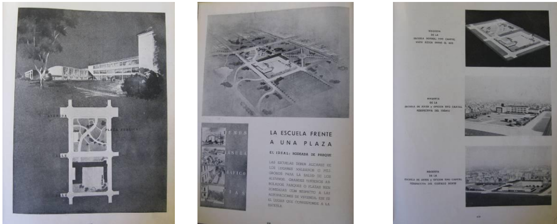
Imagen 3. Estudios realizados por la DGA. Fuente: MINISTERIO DE OBRAS PÚBLICAS, DIRECCIÓN GENERAL DE ARQUITECTURA (Julio, 1940). “Racionalización de edificios para el enseñanza secundaria. Estudios realizados por la Dirección General de Arquitectura del Ministerio de Obras Públicas de la Nación” En: RDA , N°235. pp 414-421.

camaradería 37 . En relación a las escuelas de enseñanza media en forma particular se presentó un artículo estudio realizado para la racionalización de edificios 38 no presentándose ningún ejemplo en particular sino maquetas y láminas presentadas en una exposición (imagen 3).