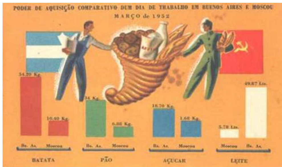
Figura 2: Ejemplo paradigmático del potencial mensaje de las “Postales argentinas”: en idioma portugués, una comparación del aparente poder adquisitivo de un trabajador de Buenos Aires y otro de Moscú, a partir de cuatro bienes de consumo popular, en marzo de 1952 (Archivo digital propio).

peronismo clásico, con un recorrido sobre los logros alcanzados. Por ejemplo, Mundo Peronista , órgano de difusión de la Escuela Superior Peronista, dirigida por Raúl Mendé, quien, desde 1950, quedó también al mando del Ministerio de Asuntos Técnicos, tenía las secciones “Cifras y razones” y “Postales estadísticas”. A la par del programa de Reconstrucción de Europa (1948-1952), se destacaba que el consumo real de calorías de los argentinos excedía al mínimo requerido, gracias al “lenguaje preciso e insobornable de las cifras” (Ramacciotti, 2009: 165). Lo hacía mediante la representación de una mesa servida con una olla que emanaba vapor, un vaso de vino, frutas y una porción de pan. Del mismo modo, Control de Estado, una poco conocida dependencia militar de la Presidencia de la Nación, publicó La Nación Argentina, Justa, Libre y Soberana (1950), tres ediciones sucesivas de una verdadera enciclopedia de ochocientas páginas. Las imágenes coloreadas y los sencillos argumentos contenidos de este manual ofrecen un mensaje pedagógico que privilegia a un auditorio popular. Recién en 1952 esas mismas cifras van a ser formalizadas en cuadros estadísticos y editadas oficialmente por la Secretaría de Asuntos Técnicos, como parte de los tres tomos del Cuarto Censo General de la Nación.