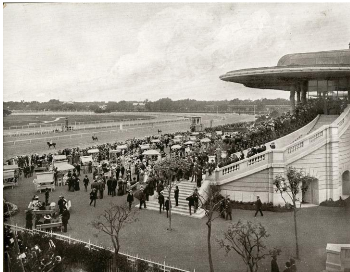
Imagen 3. Hipódromo Argentino de Palermo (1910)