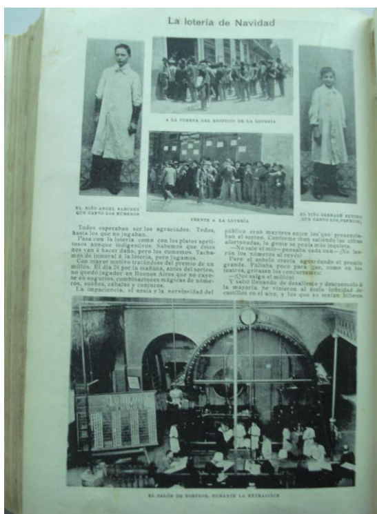
Imagen 4. Lotería de Navidad (1901).

$ m/n. Este valor de emisiones aumenta en 1905 a $ p/m 30.520.000, en 1910 a 38.175.000, en 1923 a 53.700.00 dando cuenta de la importancia de este juego para la sociedad porteña y de su significativa capacidad recaudadora. 38