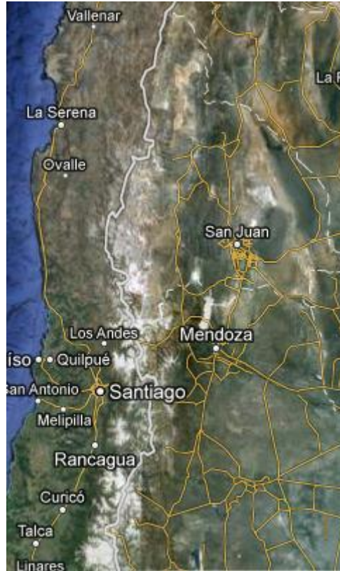
Ubicación relativa de Los Andes Centrales Argentino-chilenos

mm anuales; por el este los desiertos de la travesía; y por el sur la región del Valle Central en Chile y la región de la Payunia en Argentina.