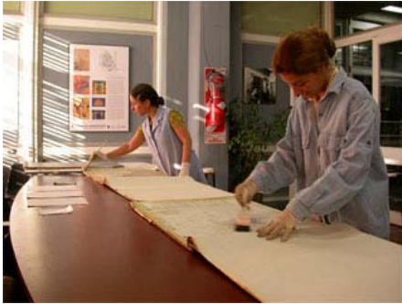
Alumnas pasantes efectuando limpieza mecánica

El rescate de documentación inédita estimula los estudios acerca de la historia de la ciudad y sus edificios, y permite que los alumnos e investigadores entren en contacto con fuentes primarias de