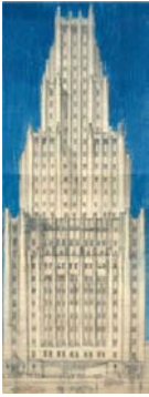
Boceto circa 1930

Casas de Renta; Edificio Granier; quinta “La Cecilia”; urbanizaciones Claromecó y Pinamar; y su casa en pendiente sobre el lago Nahuel Haupi.