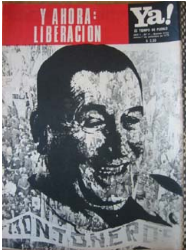
Ya! Es tiempo de pueblo, nro. 14, 27/09/73

Dos semanas después, la portada de El Descamisado de octubre de 1973, se enmarca en la toma de mando de Perón de su tercer gobierno. De manera que la fecha junto al título “De nuevo Perón con su pueblo” reflejan una nueva reunión de líder con sus seguidores. Este montaje congrega al General Perón saludando desde el balcón de la Casa de Gobierno, la palabra con la que se dirigía en sus discursos a sus partidarios -“compañeros”- y la fotografía de una multitud en la que la bandera de Montoneros se encuentra en el centro. Reuniendo en una misma página una toma cercana del recientemente nombrado presidente y un panorama de la multitud, se representa la comunión así como el diálogo entre el líder y el pueblo. Evidentemente, el criterio del montaje es recrear el “balcón” y la posible visión de Perón desde la plaza. La eficacia de la estrategia optada radica en que la cercanía de la primera imagen crea una intimidad entre el lector y el líder que no hubiera permitido una sola fotografía. Ni una toma desde atrás de Perón, enfocando el líder dirigido hacia la masa, ni el registro desde la multitud, donde ambas partes –líder y pueblo- hubiesen quedado homologados en sus dimensiones, habrían sido opciones tan funcionales como el montaje. Por su parte, la fotografía inferior aquí también identifica a la multitud bajo la dirección de Montoneros, aquella organización que marca la línea editorial de la revista 14 .