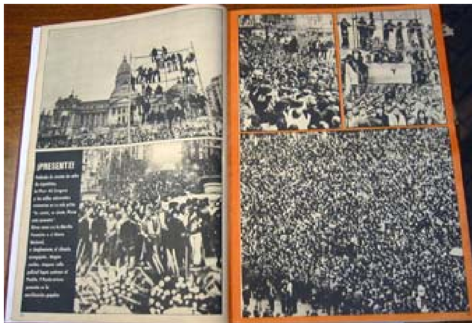
La Causa Peronista, Nro. 1, 09/07/74, Pág. 16 y 17

“¡Presente! Poblada de cientos de miles de argentinos, la plaza del Congreso y las calles adyacentes resonaron en un solo grito ‘Se siente, se siente, Perón está presente’ Otras veces era la Marcha Peronista o el Himno Nacional, o simplemente el silencio acongojado. Ningún cordón, ninguna valla policial, logró contener al pueblo. Y perón estuvo presente en la movilización popular”.