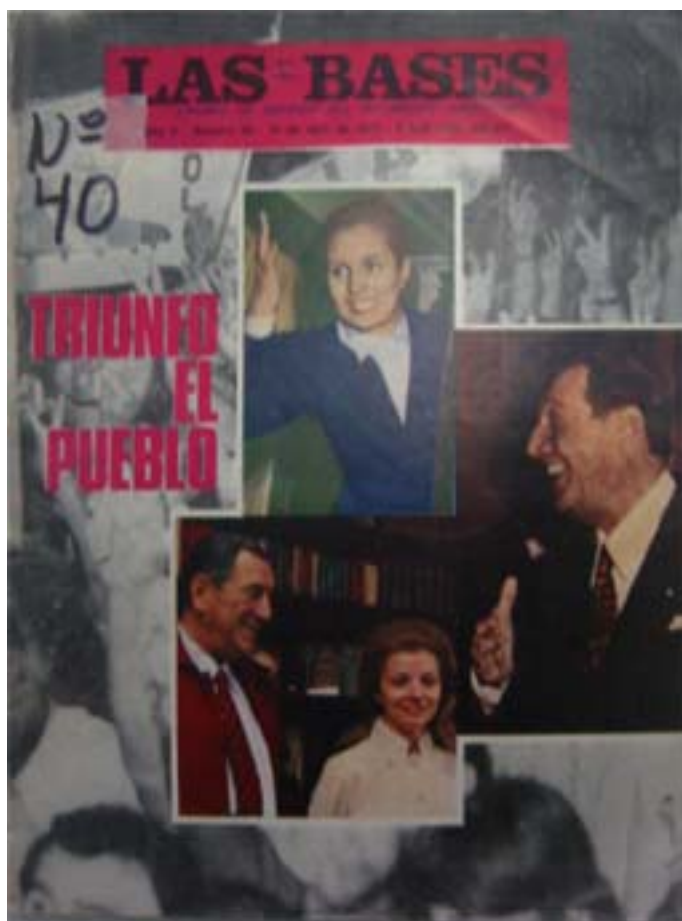
Las Bases, a o III, nro. 40, 19/04/73

beneficiarse de su legitimación. Así, el cuerpo ausente de C mpora es todo un manifiesto de la interpretaci3n del triunfo electoral como pre mbulo de una reconquista peronista del poder pol tico.