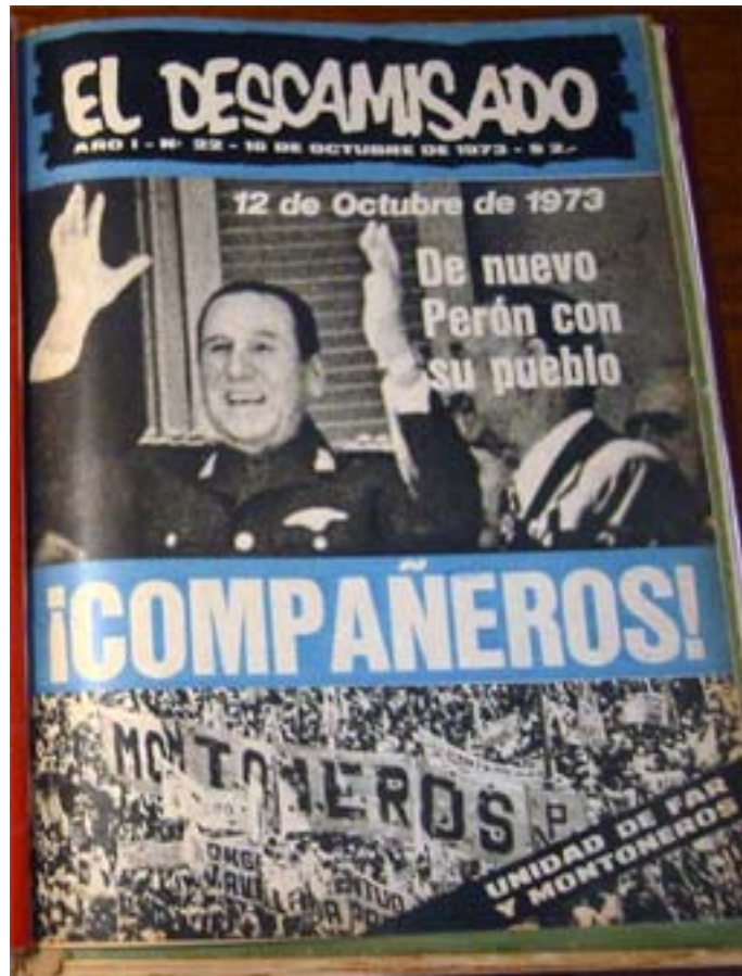
El Descamisado, año 1, nro. 22, 16 de octubre de 1973

Tras la muerte del General, la primera portada de La Causa Peronista se encuentra despojada de fotografías. Sólo figuran las palabras “Murió nuestro líder. Los peronistas quedamos solos” sobre un fondo naranja y una franja negra indicando el duelo. Esto se completa al interior de la revista, donde de las páginas 13 a la 19 se exponen fotografías de personas en estado de congoja ante la muerte de Perón la cual, según la revista, generó “bronca y dolor”. Así, en las páginas 16 y 17, las imágenes reproducidas aquí funcionan como prueba de la soledad en la que quedó “el pueblo” sin su líder. Cinco fotografías de la aglomeración frente al Congreso fueron dispuestas en esas dos páginas, todas tomadas desde perspectivas que permiten mostrar la monumentalidad de esta manifestación en tanto la cantidad de gente excede el campo visual. La primera es de particular interés, puesto que se compone de la fachada del Congreso Nacional, parte de la muchedumbre, y algunos jóvenes de espaldas al fotógrafo trepados a un andamiaje donde se reconoce un retrato de Perón. Dicha fotografía podría merecer una lectura simbólica, probablemente la que condujo a su publicación en la revista. La juventud se apodera de esa estructura metálica como gesto simbólico de arrebatar el relevo del poder, asumiendo activamente la herencia del líder