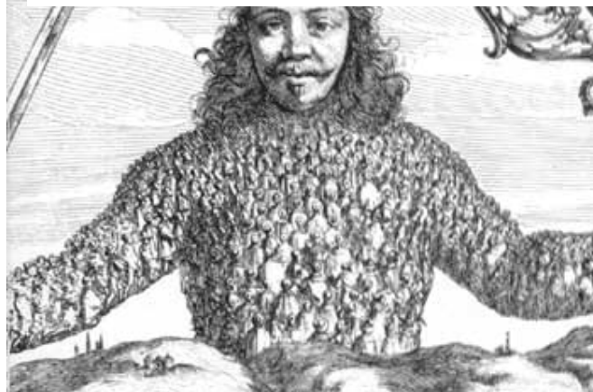
Ilustración de la portada de la obra de Thomas Hobbes El Leviatán (1651) elaborada por el grabador Abraham Bosse

Primicia Argentina , N° 15, 30/04 al 6/5 de 1974, p. 4