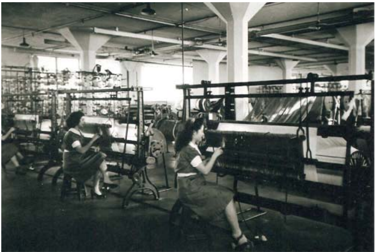
Foto 2: “Fábrica Argentina de Alpargatas, tejeduría, 1943.”