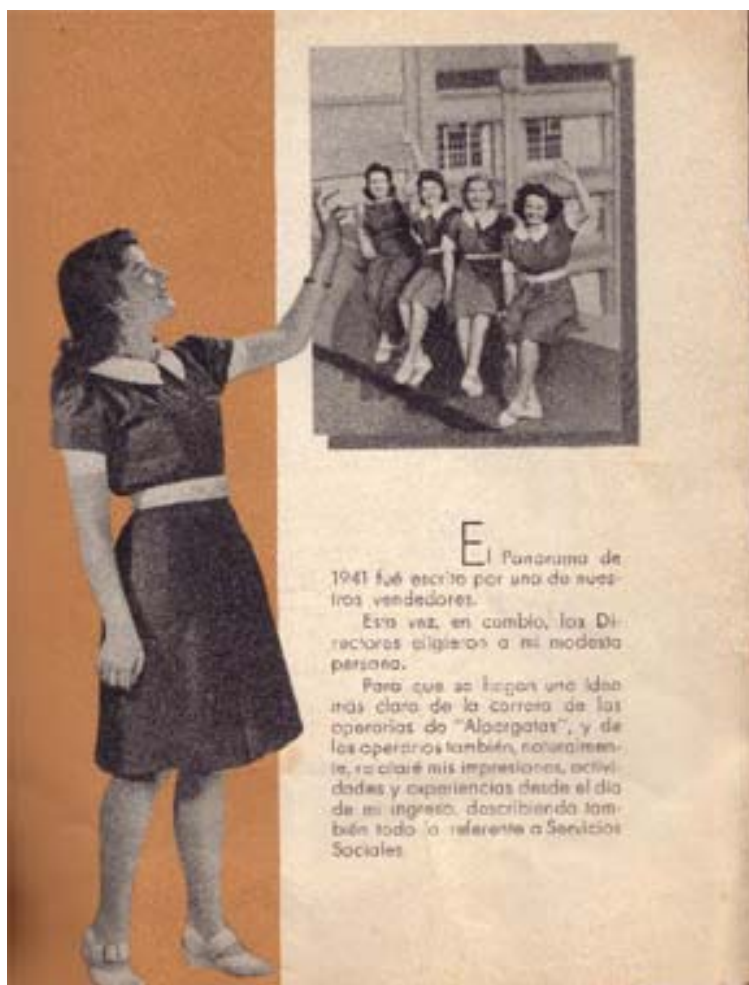
Foto3 : Revista Panorama de Alpargatas 1942, pág. 2.

En la foto 3 vemos la imagen de una empleada, nuevamente muy bien vestida con un uniforme, prolija, elegante, con sandalias de taco alto, cabello suelto, bien peinado, sonriente y dispuesta a iniciar la narración de su experiencia, según lo enuncia el texto que se articula con la imagen. Ella está señalando la tapa de la revista Panorama de Alpargatas de 1942, en ella se ven otras cuatro trabajadoras, sentadas sobre una pared baja de la planta fabril, saludando sonrientes. Todas visten uniformes con distintos colores, según la sección y distintos cuellos según las jerarquías de cada una –obreroa o empleada-. Sin lugar a dudas, esa empleada estuvo allí , Barthes diría “ eso fue ” 19 , pero como espectadores privilegiados podemos advertir la función que su imagen fotográfica cumple. Ella se presenta como trabajadora de la empresa, contenta y agradecida por todo lo que Alpargatas le brinda y representa de este modo al conjunto de las trabajadoras. Se evidencia el doble poder de la imagen, según Louis Marin, por un lado en su dimensión reflexiva , la empleada se muestra a sí misma, tal como es su situación, bien vestida, contenta, agradecida; y por el otro, ella