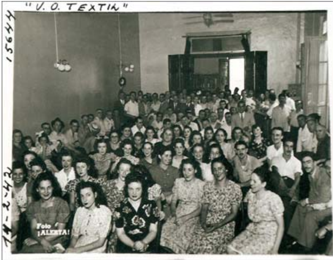
Foto 5: "Unión Obrera Textil, 14-02-1942"