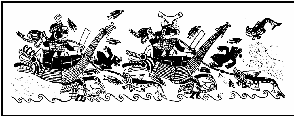
Figura 2. Pescadores peruanos en tup .

“... la de pinta, 9 es una pesca individual, el hombre sale montado en su embarcación, lleva consigo una bolsa de red llamada caçal , varios anzuelos de diferentes tamaños, carnada al que dicen meñóca , unos mates por boyas y una piedra atada a una cuerda sirve de ancla. El pescador se dirige al lugar escogido, hecha ancla y también los anzuelos; a medida que caen los peces los pone en el caçal .”