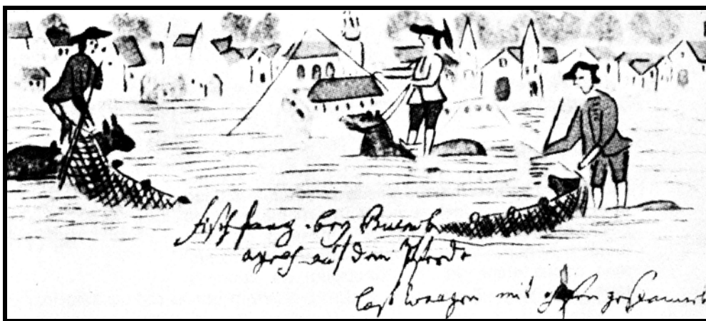
Figura 3. Pescadores de San Fernando de 1749.

Otro cronista clásico como fue Alonso Carrió, más conocido por su apodo “Concolorcorvo” (1775:92–93), nos habla de la pesca y comercialización del pescado en la Buenos Aires pre–virreinal: