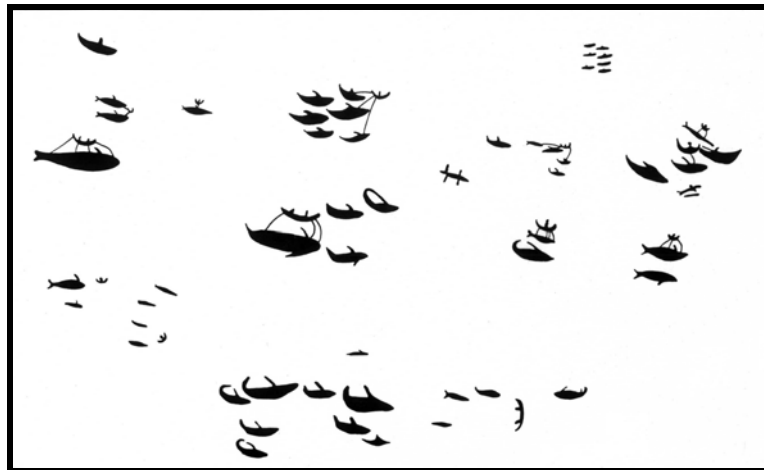
Figura 1. Pesca de ballenas en la costa. 1

El artista del gráfico precedente fue ratificado miles de años después cuando el cronista Vargas Machuca dijera en el siglo XVI: