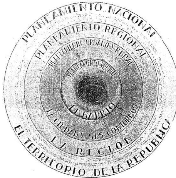
Gradación de los planes reguladores (RA, 1946, pág. 310)

y rural. La formulación del Plan se llevaría a cabo a través de una trama de planes regionales.