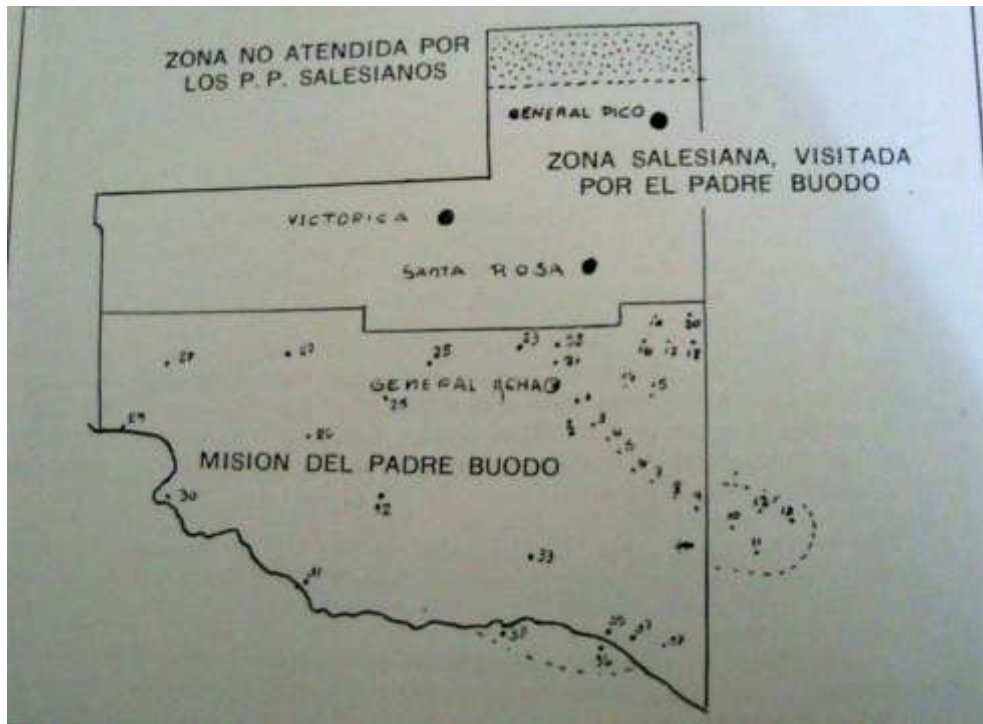
Zona de Misión del padre Buodo. Valla (1999:2).