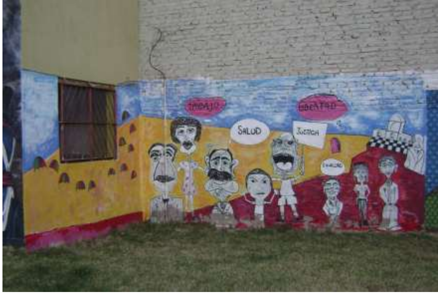
Alumnos de la ESAV