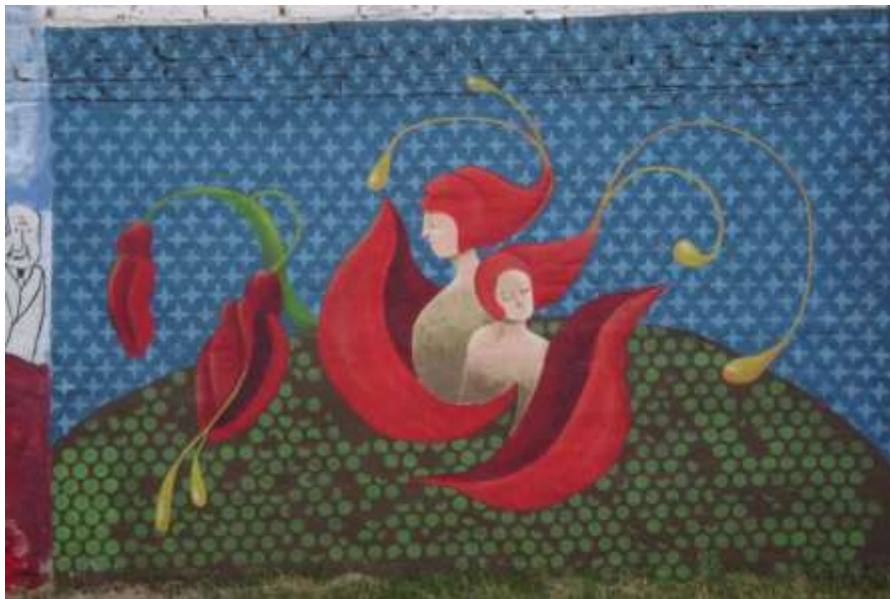
Directores de la ESAV