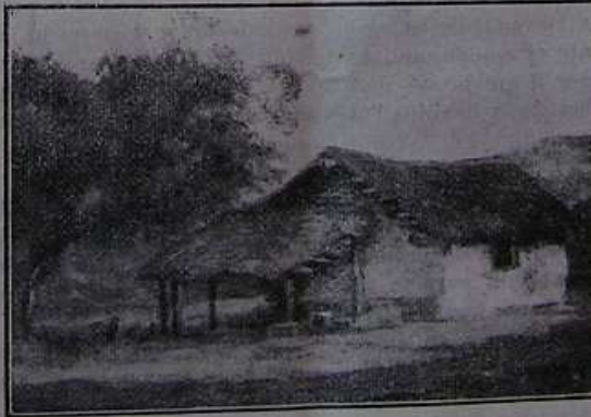
RANCHO CORDOBÉS ÓRG. DE BLANCA C. DE HUME

Más allá de la tierra y las estrellas Un día, al fin, de su sublime anhelo Alcanza el corazón la ignota cumbre.