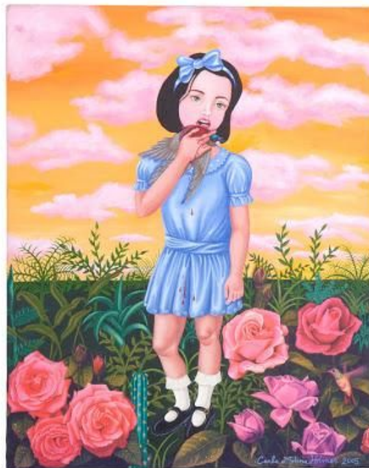
Niña Perversa Polimorfa