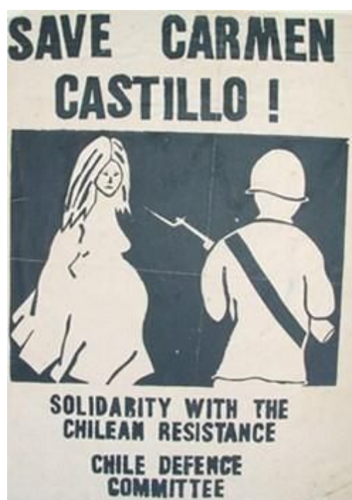
Comité Internacional de Solidaridad con Carmen Castillo